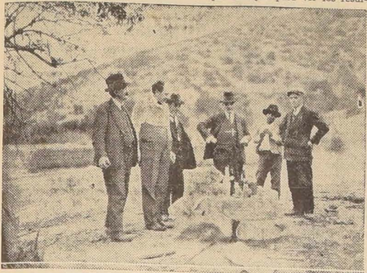
Mineral de Millacura, situado en el camino a San Antonio, cuyos desmontes auríferos fueron ensayados ayer en la Quinta Normal