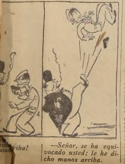
—Señor, se ha equivocado usted; le he dicho manos arriba.

"La primera fase de la evolución de una democracia triunfante consiste en destruir las antiguas aristocracias; la segunda, en crear otras nuevas". —Gustavo Le Bon.