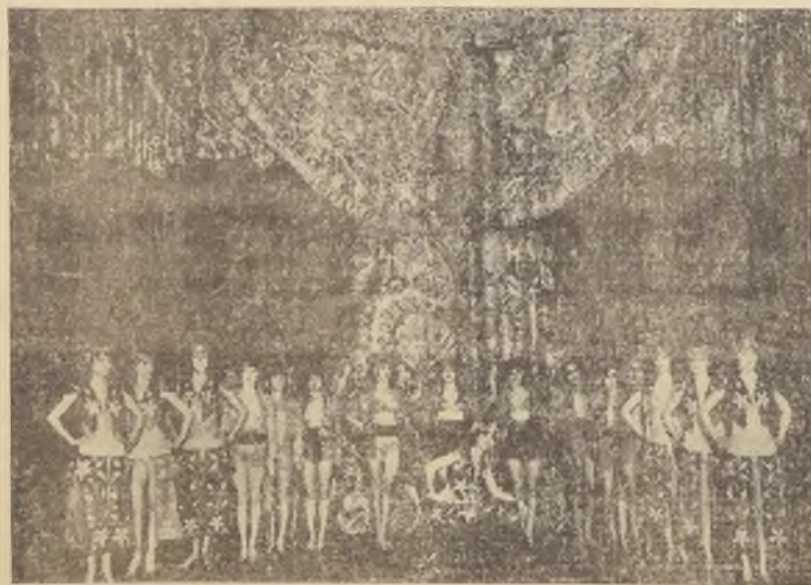
El cuadro del Capote de paseo de la revista "Seda y Oro"