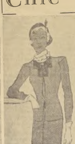
Traje sastre, de lana a rayas, de Dukusha. El canesú de la chaqueta es de terciopelo negro "coté". Cierra con broches de metal. La blusa gris es de tela elástica.