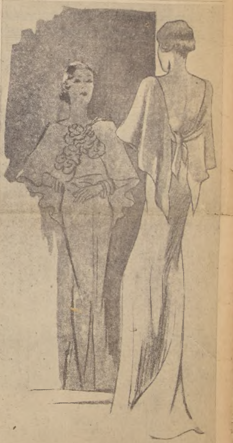
Suntuosa capa de lamé verde pálido sencillamente anudada por detrás y sujeta en el pecho con un ramo de flores. Modelo de MOLY-NEUX.