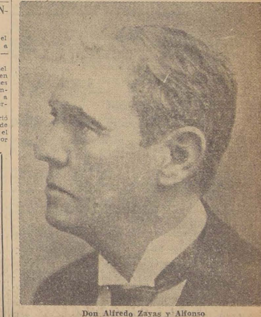
Don Alfredo Zayas y Alfonso