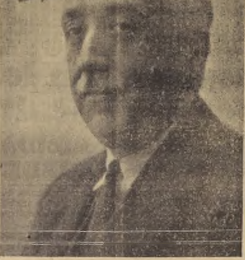
Excmo. señor Presidente de la República de España, don Niceto Alcalá Zamora