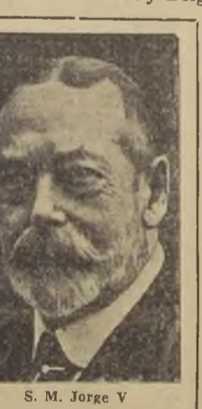
S. M. Jorge V