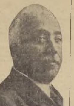
N. Alcalá Zamora