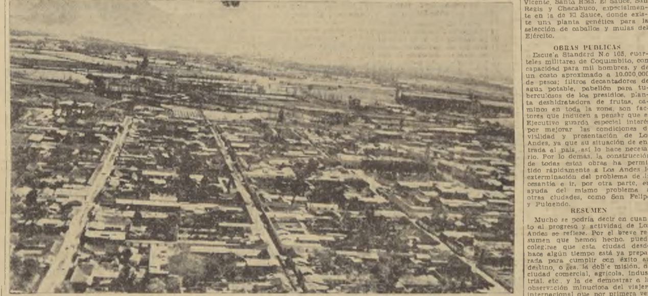
Vista panorámica de Los Andes

INDUSTRIAS... "En el aspecto industrial. Los Andes es el fuerte de toda la región..."