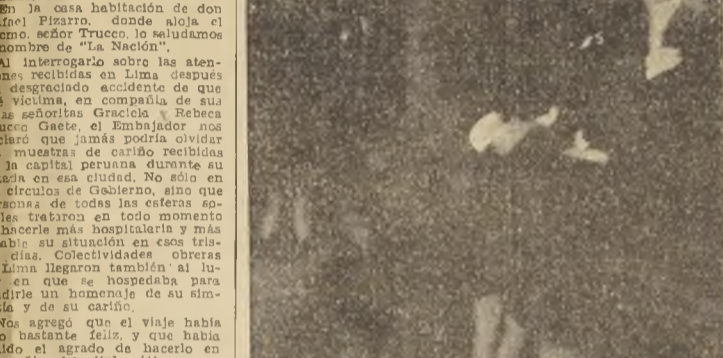
El Embajador Trucco y sus hijas Graciela y Rebeca, ayer en su residencia.

medicos peruanos que lo atendieron. En cuanto a la restitución de sus funciones en E. U., nos manifestó que sólo esperaba su completo restablecimiento y las órdenes pertinentes del Gobierno para reasumir su puesto de Embajador. Al despedirnos del distinguido diplomático, nos agradeció el saludo de nuestro diario, a cuyo nombre le formulamos nuestros deseos de pronto restablecimiento.