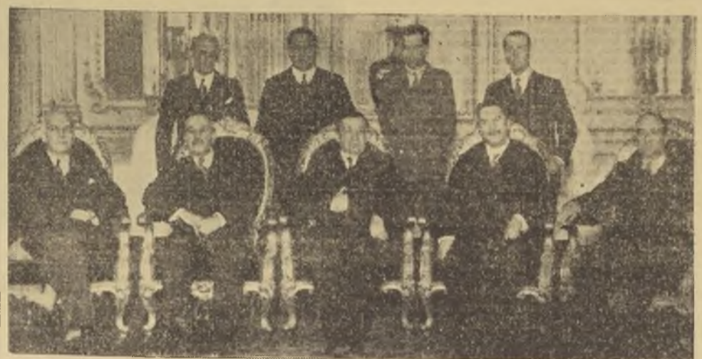
El Excmo. señor Alessandri con el nuevo Ministerio

Los Ministros del Interior y de Tierras y Colonización asumieron ayer mismo sus funciones; los de Educación y del Trabajo lo harán hoy.— Declaraciones de los Ministros respecto de la labor que abordarán en el desempeño de sus carteras