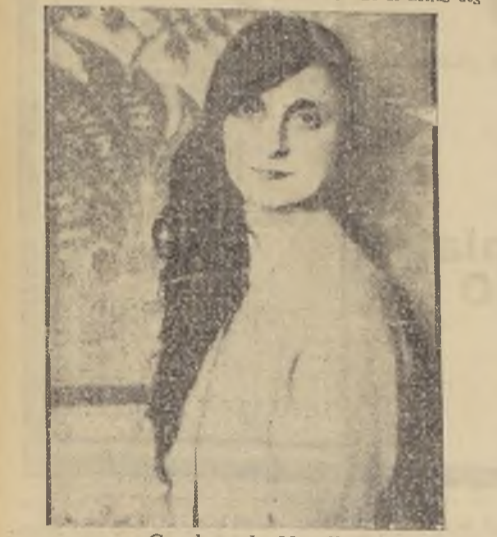
Condesa de Noailles

La lucha es entabla ya entre las dos veteranas: ambas sacan energías del fondo de sus numerosas décadas para imponer en un torneo de la inteligencia, de la resistencia de la fuerza moral, ¿quién derrocará a quién? Entretenido en el teatro político que es la Cámara de Diputados, los descreditados representantes del pueblo no logran un apauso y la terrible comedia que se representa, hace murmurar a todos los electores.