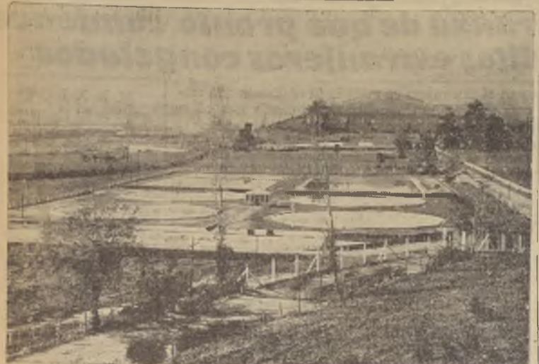
Los filtros decantadores y purificadores del agua potable, de Los Andes, San Felipe y Curimón