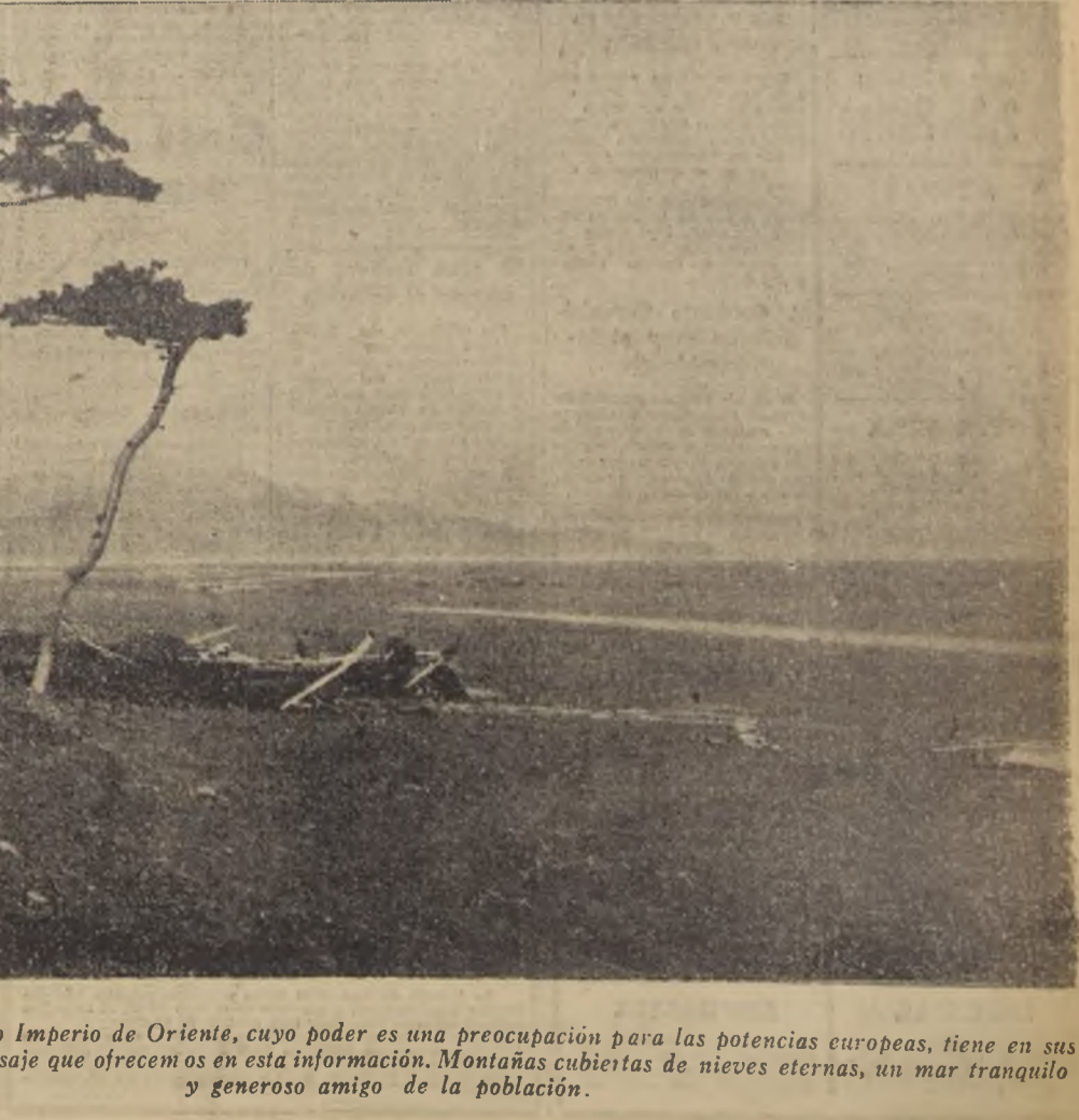
El Japón, el maravilloso Imperio de Oriente, cuyo poder es una preocupación para las potencias europeas, tiene en sus campañas el delicado paisaje que ofrecemos en esta información. Montañas cubiertas de nieves eternas, un mar tranquilo y generoso amigo de la población.

poles que, por su naturaleza, parecen dignos, exclusivamente de la juventud y de la fresca belleza que se atribuye al diablo. No hay tal secreto cuando se conoce un poco la movilidad espiritual del pueblo francés. Esfóticamente a pesar de su inclinación por los placeres físicos una de cuyas apreciadas manifestaciones es su renombrada cocina y la exquisita de sus vinos, el francés admira, ante todo, la osadía y renacho, el valor civil lo que en resumen es fruto de la belleza interior indestructible por el tiempo. La juventud no neces-