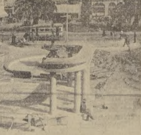
Una transformación de la Plaza Echaurren mejorará un importante sector porteno