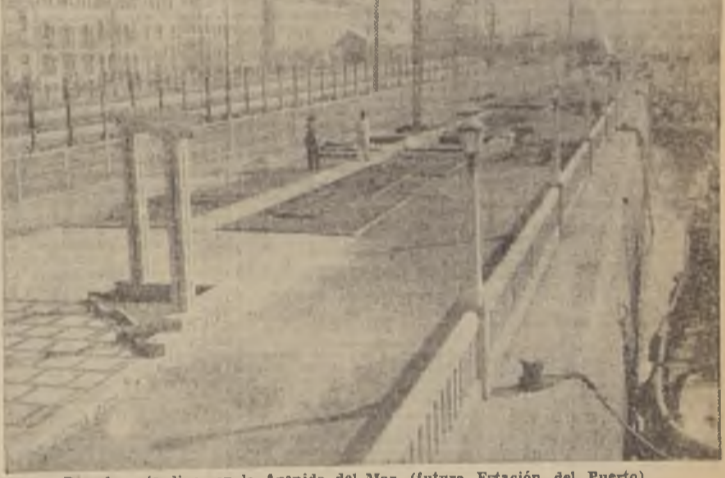
Pergola y jardines en la Avenida del Mar (futura Estación del Puerto)