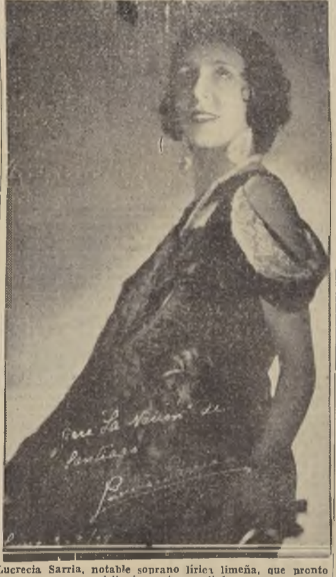
Lucrecia Sarria, notable soprano lírica limeña, que pronto visitará nuestra capital