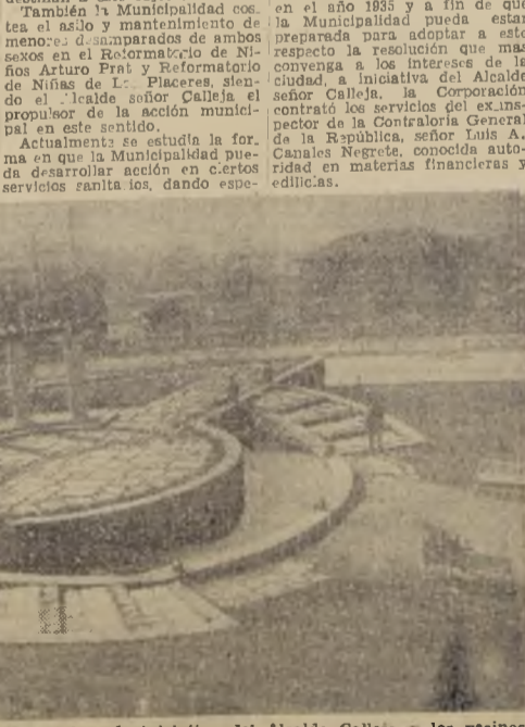
Una hermosa Plaza Bismarck, que se debe a la iniciativa del Alcalde Calleja y los vecinos