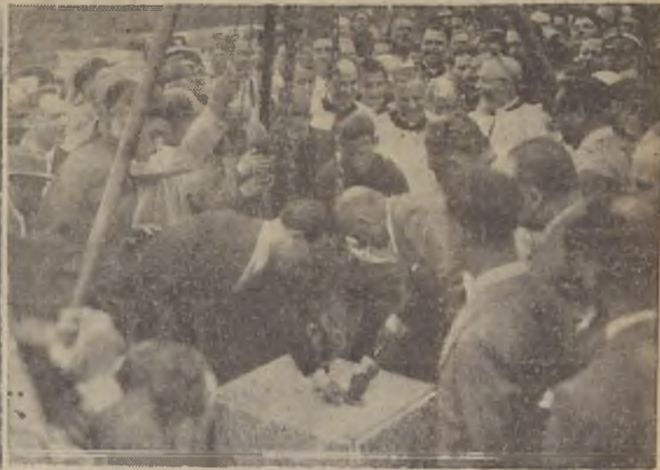
Las regiones palúdicas del Pontino, se han transformado por obras de espíritu de Mussolini en hermosas ciudades y campos de cultivo. El 15 de Abril del año en curso, el Duce inauguraba Sabaudia, la segunda ciudad construida sobre aquellos pantanos. Los aspectos que ofrecen los grabados son el momento de poner la primera piedra (el Premier Italiano aparece poniendo la clásica mezcla de cemento) la nueva ciudad que surge, moderna y confortable, dedicada especialmente para centro obrero rural.