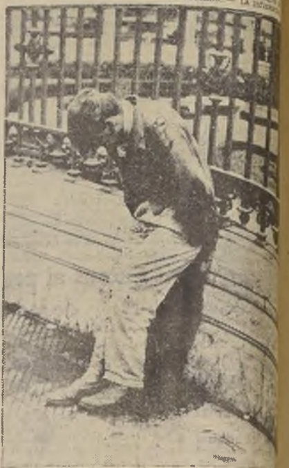
Doblado, por el peso de su desgracia, el cesante en tiempos, daba a la ciudad una fisonomía de indolencia