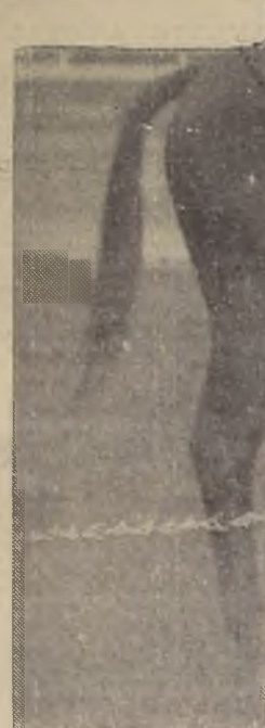
Haga cuenta, que no corre. SAYAL 47. (J. M. Aroa) No lo colocamos por el momento. SOL A SOL 47. (L. A. Vázquez) A lo más como cubierto. 3. a Carrera. — 1.500 metros.

VITELIO, el mejor productó de la generación y que el domingo próximo en el Club Hípico, debe conseguir su cuarto triunfo clásico, pues se destaca netamente en el Premio Concepción.