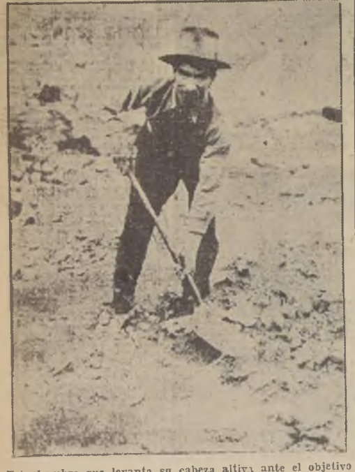
Este hombre que levanta su cabeza activa ante el objetivo de nuestro fotógrafo, está poseído de la entereza y el orgullo que proporciona el trabajo y la certeza de un pan para sus hijos