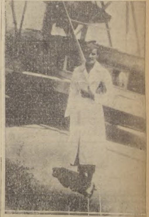
Katherine Hepburn en La Habana