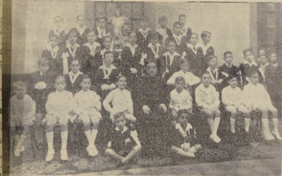
El Rector del Colegio y alumnos que hicieron ayer la Primera Comunión en este establecimiento