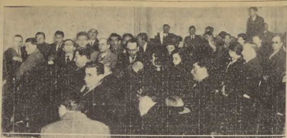
Durante la sesión de anoche de la Convención Judía