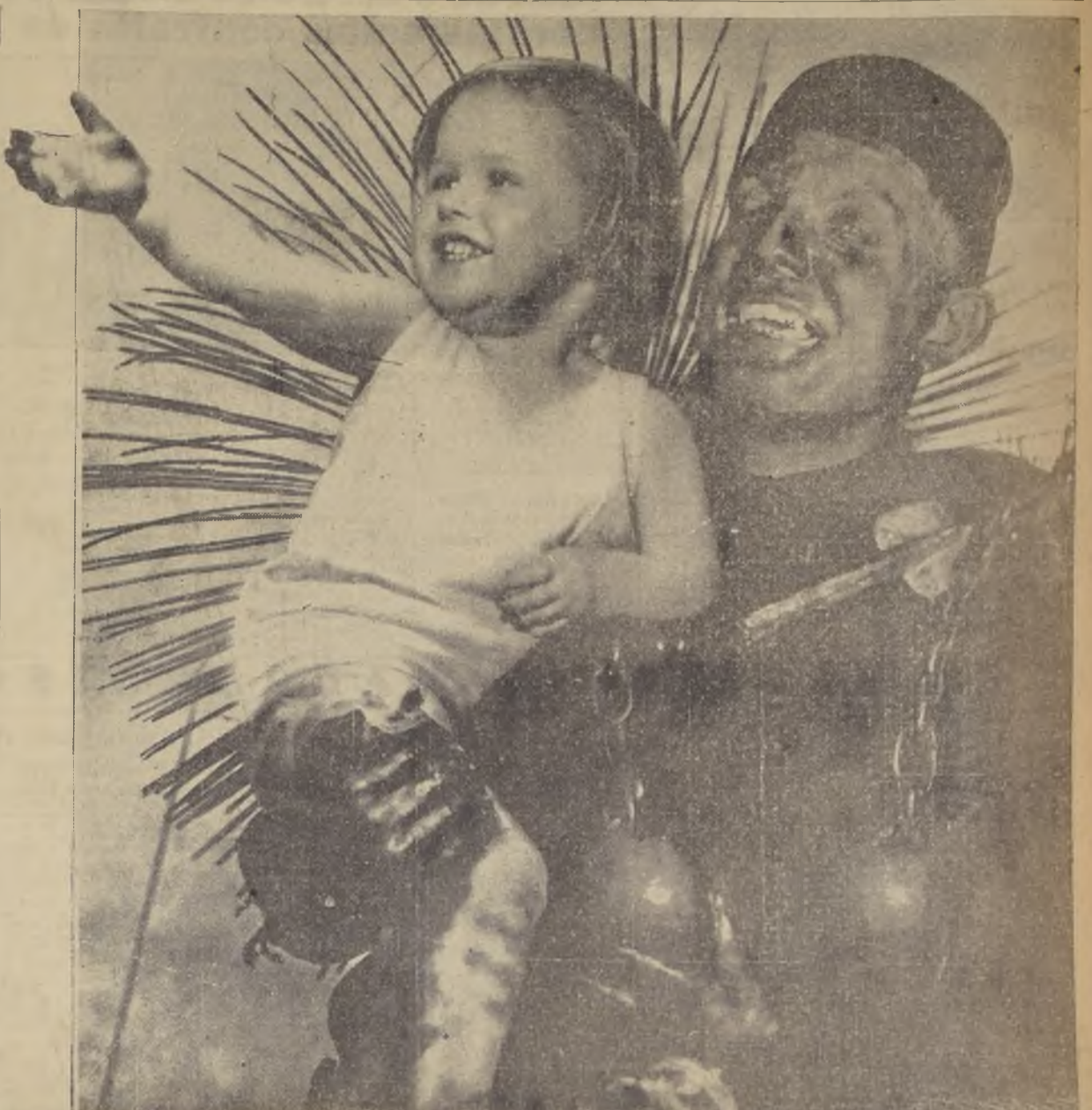
PAZ! PAZ! Este es el eco que resuena en todo el mundo como una reacción lógica al período que culminó con la Gran Tragedia de 1914. La generación que nace en esta parte del siglo, representada por la inocente figura del niño tendido en brazos del guerrero, está harta de guerras, destrucciones y muertes; quiere paz, tranquilidad y progreso a la sombra augusta de la concordia y armonía entre los pueblos, que es lo que pregonan sus hombres de Gobierno y jefes de los grandes sectores de opinión.