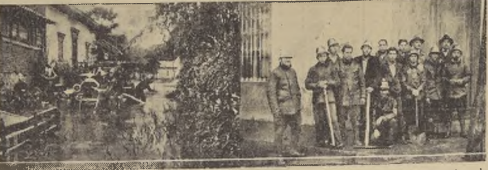
1. Los bomberos de Peumo en plena labor durante el último temporal.—2. Parte del personal que participó en la labor de salvamento en una de las calles del pueblo