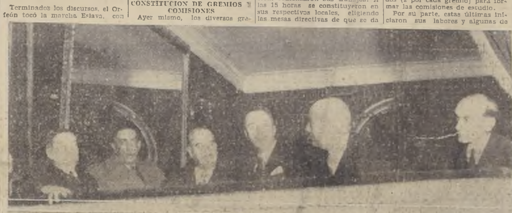
En el palco presidencial, S. E. asiste a la inauguración en compañía de los Ministros del Interior, de Relaciones y de Fomento, y del Director General de Investigaciones