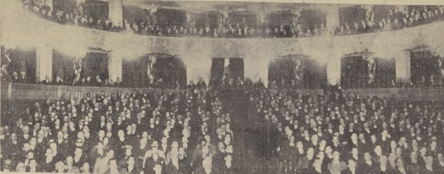
Aspecto que ofrecía el Teatro Municipal, durante la sesión inaugural de ayer

EL ACTO INAUGURAL SE VERIFICO EN EL TEATRO MUNICIPAL, ANTE GRAN CONCURRENCIA DE DELEGADOS DE SANTIAGO Y DE PROVINCIAS. — LOS DISCURSOS. — LOS DIVERSOS GREMIOS REPRESENTADOS EN ESTE TORNEO, DESIGNARON EN LA TARDE SUS MESAS DIRECTIVAS Y LAS COMISIONES. — EL PROGRAMA DE HOY. — OPINIONES DE VARIOS DELEGADOS SOBRE LA CONVENCION Y SUS PROYECCIONES