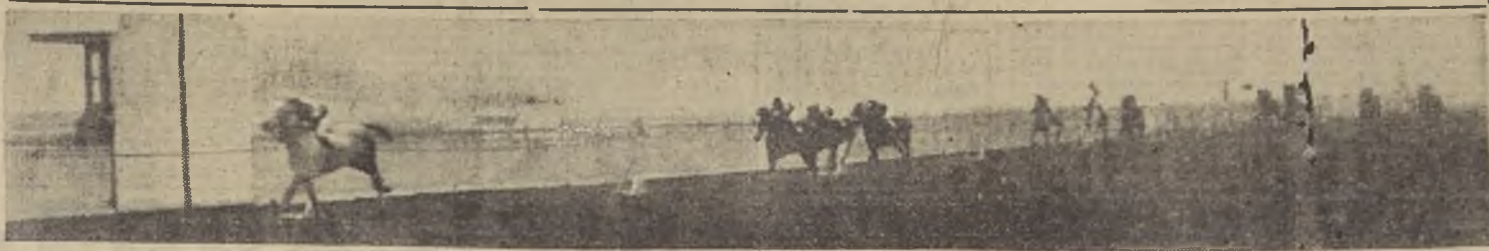
Sucre, al galope, delante de Insulto, Buen Rumbo y Chansonnier

En la tarde fría y amena, una numerosa concurrencia ayer se congregó en el Hipódromo de Palermo para presenciar el clásico "Handicap de Otoño", prueba básica de la temporada, que se desarrolló en un día de gran animación y con una nota discordante, al producirse un accidente que ocasionó la muerte de un caballo.