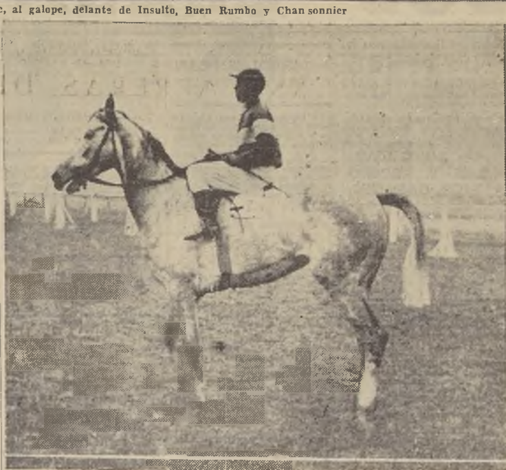
Sucre, por Citoyén y La Paz, ganador del clásico "Handicap de Otoño.—Jinete: A. Gutiérrez

En todo momento Pillería, mantuvo dos cuerpos sobre Insulto, y sin variaciones de importancia llegó el grupo a la recta de los mil metros, en donde Sucre se aproximó a Insulto y Narciso avanzó hasta colocarse cuarto en un rush espectacular.