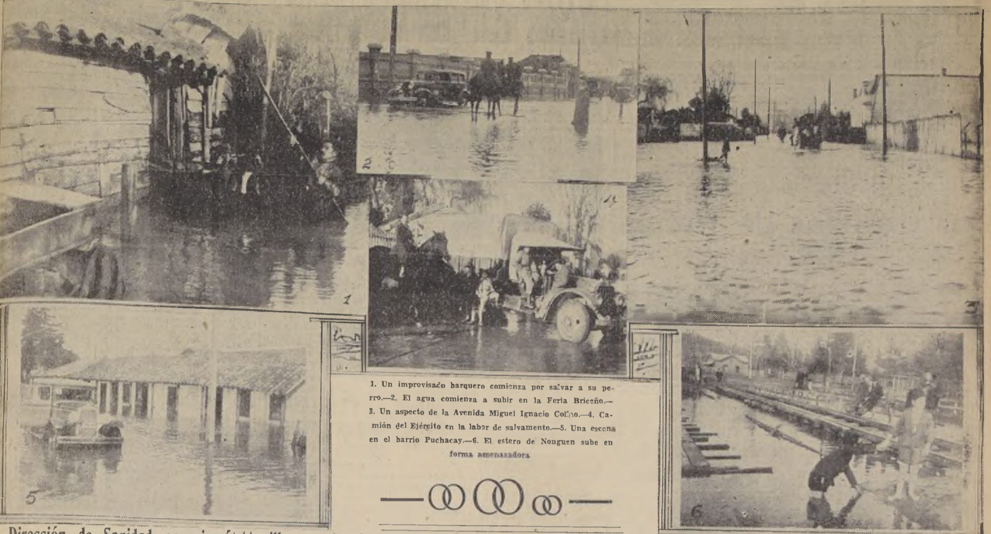
1. Un improvisado barquero comienza por salvar a su perro.—2. El agua comienza a subir en la Feria Briceño.—3. Un aspecto de la Avenida Miguel Ignacio Colla.—4. Camión del Ejército en la labor de salvamento.—5. Una escena en el barrio Puchacay.—6. El estero de Nonguen sube en forma amenazadora.