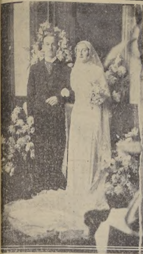
Los novios después de la ceremonia religiosa. CLUB DE LA UNION. — APERTURA-CONCERT. — CLUB DE SEÑORAS.

De 12.15 a 13.15 horas se llevará a efecto hoy domingo, en el gran hall del Club de la Unión, el Apertiff-Concert semanal.