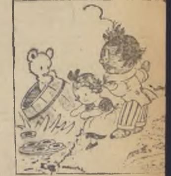
Y consiguen de ese modo Apoderarse de todo.