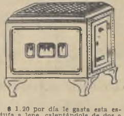
Librería y Editorial Nascimento

Golcochea rechazó los ruegos del Premier Samper para que retirara la petición en cuanto al quorum para la aprobación de la