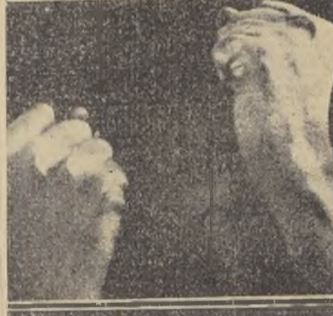
Los puños fuertemente cerrados, son signo de la energía que Hitler pone en su acción

El foco del malestar está dominado con la expulsión y prisión de Roehm... Además, Hitler cuenta con el apoyo tácito de la poderosa Reichswehr. — Y está dispuesto a entrar en acción al menor asomo de emergencia