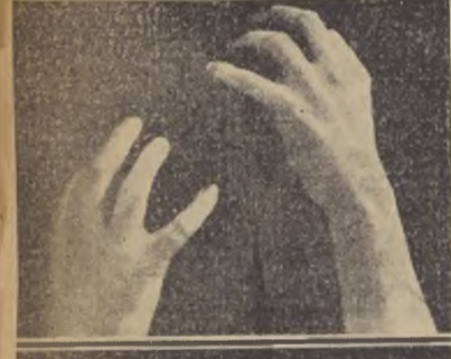
Las manos crispadas, pareciera que el Canciller se mostrara dispuesto a triturar a sus enemigos...