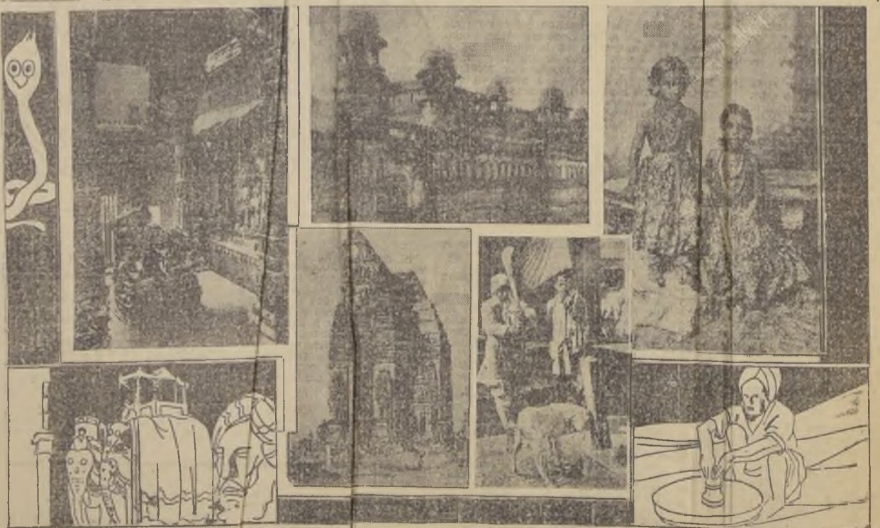
1) La "Sala del Toro Sagrado", en el templo de Gozain, en B... 2) El Palacio Real de Man Singh, notable construcción de estilo hindú que data de... 3) Dos niñas indias... 4) Interesante ejemplar de arquitectura hindú: el templo de Quator, construido entre... 5) En el "Templo"...

LA VIEJA INDIA, país de las religiones, ha adorado a sus dioses con más fastuosidad que ningún pueblo, que ninguna época. Sus monumentos, obras geniales de la concepción y del gusto, son los primeros del mundo. Allí está el Egipto con sus piedras milenarias un tanto raras, un tanto incomprendibles. Allí está la China, fría celeste, con sus porcelanas "traqueles" y con sus murallas inescalables... Murallas para sus límites, murallas para las calles de su Pekín, siempre extraña, siempre cruel, y allí está el Japón diminuto y poderoso, con sus grandes avenidas, sus playas de estacionamiento y sus deliciosas casitas de papel, con sus parques de belleza insuperablemente estilizada y su escuadra magnífica. Pero la India, algo arrumbada, al-