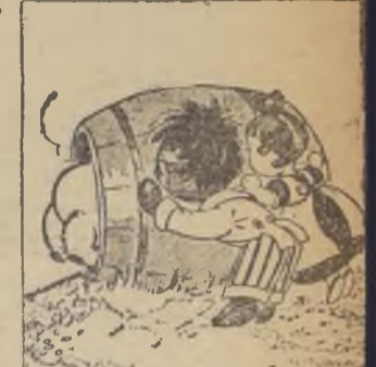
Los otros lo hacen rodar Con audacia singular.