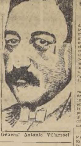
General Antonio Villarreal