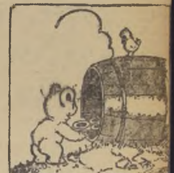
Adentro de los toneles Guarda el oso los pasteles.