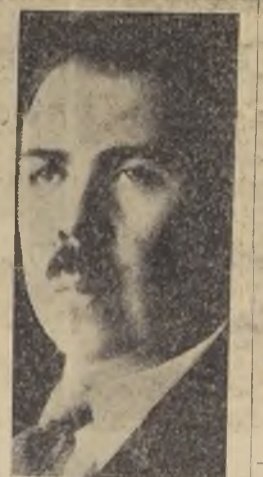
General Lázaro Cárdenas

Las acusaciones del coronel nicaragüense Zepeda, que un tiempo fue representante del famoso ejército general rebelde Augusto Sandino, el Ministro norteamericano en Managua (Nicaragua) — Mr. ... — en relación con la muerte de Sandino, junto con varios otros cargos sin base alguna (como ser, que un destacamento de soldados de marina va hacia Nicaragua) están creando una situación embarazosa para el Gobierno mexicano.