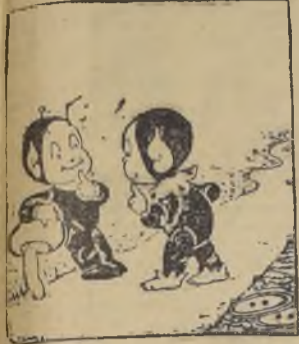
Pepe Honguito halló una vez una cáscara de nuez.