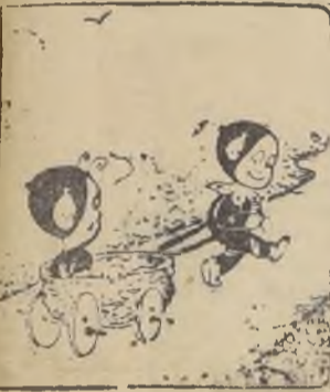
E hicieron un cochecito, como se ve, muy bonito.