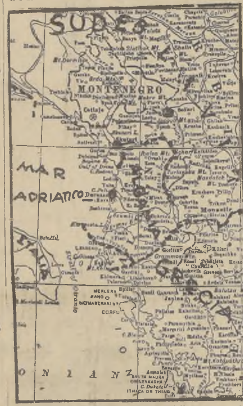
Albania, Sudeslavia, Grecia y parte de Italia, el foco de las dificultades internacionales denunciadas a la Liga de las Naciones

Igual cosa se ha hecho con la artillería de montaña que hay en la guarnición cerca de Scutari. También se han suspendido los permisos de los soldados de todas las guarniciones situadas en la frontera italiana y albanesa. — (U. P.)