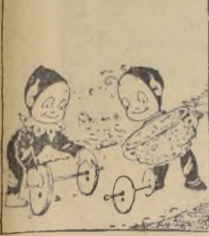
Unas riendas prepararon con rodela que encontraron