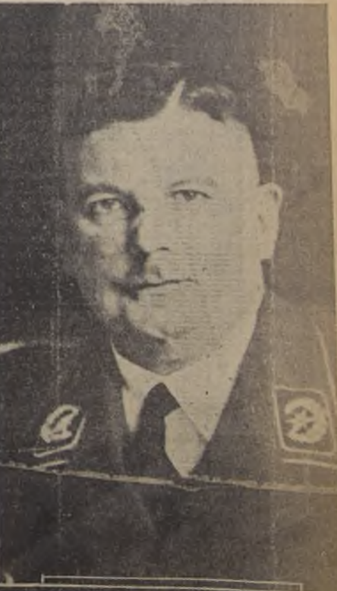
Capitán Ernst Roehm, el hombre que fuera el mejor amigo y confidente del jefe del nazismo, y que pagara con su vida la traición al leader

BERLIN, 1.º — Los resultados principales de la acción de Hitler parecen ser: 1.º que la posición personal del Canciller se ha robustecido; 2.º que han cambiado los fundamentos del poder del régimen más hacia la derecha; 3.º que Hitler eliminó una de las mayores dificultades internas al deshacerse de los extremistas de las "guardias de asalto"; 4.º que debilitó y dividió a los elementos de izquierda del partido nazista; 5.º que se han dado los primeros pasos para "arrancarle los dientes" a las "guardias de asalto", transformándolas en una "suave guardia pretoriana"; y 6.º que obtuvo la división y la promesa de algunos líderes nacionalistas de la derecha.— (U. P.)