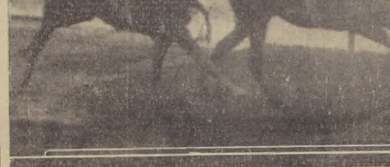
En la serie principal de la reunión del Hipódromo Chile, Aborigen da cuenta de Everest.

A la altura de los 920 metros, Forest Noire pasó a la cabeza, con un tiempo de 1:36.50. El segundo fue Forest Noire, con un tiempo de 1:37.50. El tercer fue Princeps, con un tiempo de 1:38.50. El cuarto fue Blue Jacket, con un tiempo de 1:39.50. El quinto fue Estética, con un tiempo de 1:40.50. El sexto fue Portiere, con un tiempo de 1:41.50. El séptimo fue Forest Noire, con un tiempo de 1:42.50. El octavo fue Dicho y Hecho, con un tiempo de 1:43.50. El noveno fue Forest Noire, con un tiempo de 1:44.50. El décimo fue Forest Noire, con un tiempo de 1:45.50.