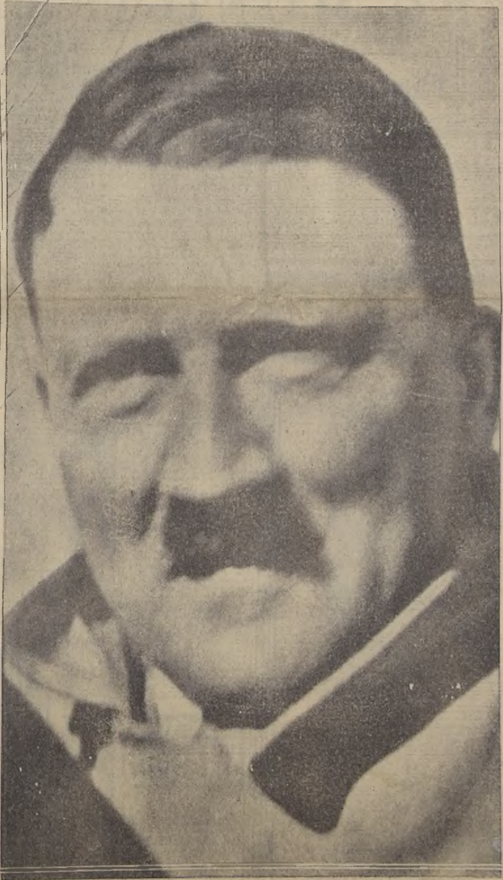
El Canciller Hitler sonre satisfecho de la forma cómo su Gobierno dirige los destinos del Reich

do que se encuentra bajo una vigilancia protectora igual a la que se puso al vicecanciller Von Pappen.— (U. P.)