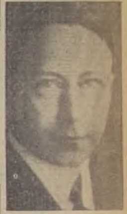
El ex-Kronprinz, de quien se dice que desapareció de Berlín al ocurrir los sucesos del sábado

MUNICH, 1.º — A las 13 horas se supo que Ernst Roehm se encontraba todavía en la prisión de Stadelheim. La salud de Roehm es buena y recibe el tratamiento corriente de los detenidos. No obstante se encuentra estrictamente vigilado como medida preventiva. Los seis fusilamientos de ayer sábado tuvieron lugar en la misma prisión en que se encuentra Roehm, de modo que éste pudo oír todos las descargas hechas