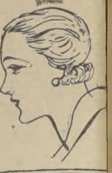
Señoritas que ayer

T. Imperia SAN DIEGO 1344 Hoy Popular. Plates $ 1.20 y Lindas películas 2. 1.º "La Pecadora", por Joan Crawford, y 2.º "Diablos del Cielo", por Spencer Tracy.