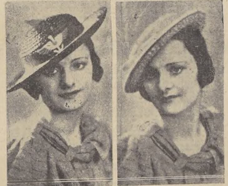
Sombrero bretón de paja gruesa negra, adornado con cinta "gros grain" y un anillo, de "chez" Suzy.