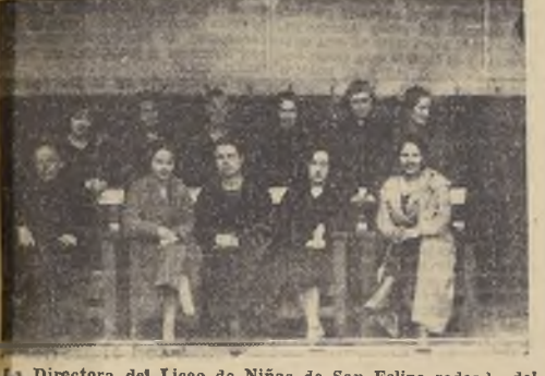
La Directora del Liceo de Niñas de San Felipe rodeada del profesorado que la secundan

300 alumnas reciben instrucción en este plantel de educación femenina.—Cuenta con tres cursos preparatorios y cinco de Humanidades