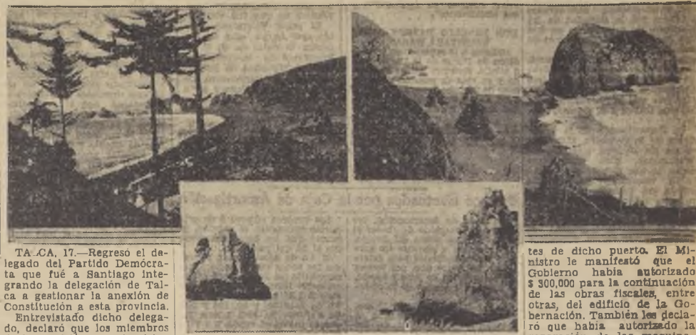
Tres hermosos paisajes de Constitución

Favorablemente impresionada, regresó la comisión que vino a Santiago a gestionar la anexión de ese Departamento a la Provincia de Talca. — Se aproxima el resurgimiento del puerto de Constitución