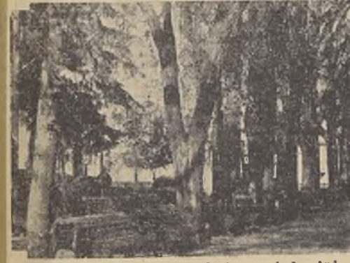
Plaza de Armas de Los Andes

Nuevas gestiones han iniciado el Alcalde y la prensa local.—El domingo próximo se realizará una gran concentración en el Teatro Andes