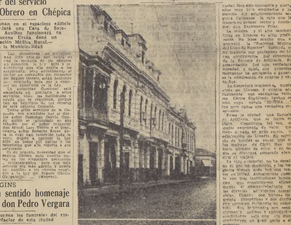
La calle Independencia de Linares

CALES AMPLIAS CON EDIFICIOS MODERNOS Y UNA PLAZA QUE PUEDE FIGURAR ENTRE LAS MEJORES DEL PAIS, IMPRESIONAN FAVORABLEMENTE AL VIAJERO.—CUENTA CON BUENOS SERVICIOS EDUCACIONALES, Y SUS ACTIVIDADES CULTURALES Y COMERCIALES HAN ALCANZADO GRAN DESARROLLO