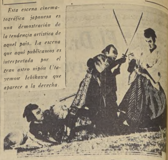
Esta escena cinematográfica japonesa es una demostración de la tendencia artística de aquel país. La escena que aquí publicamos es interpretada por el gran astro nipón Utagomori Ichikawa que aparece a la derecha.