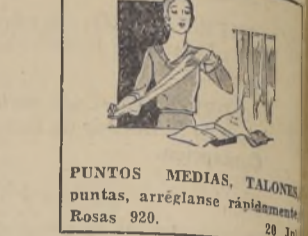
PUNTOS MEDIAS, TALONERAS puntas, arreglense rápidamente.