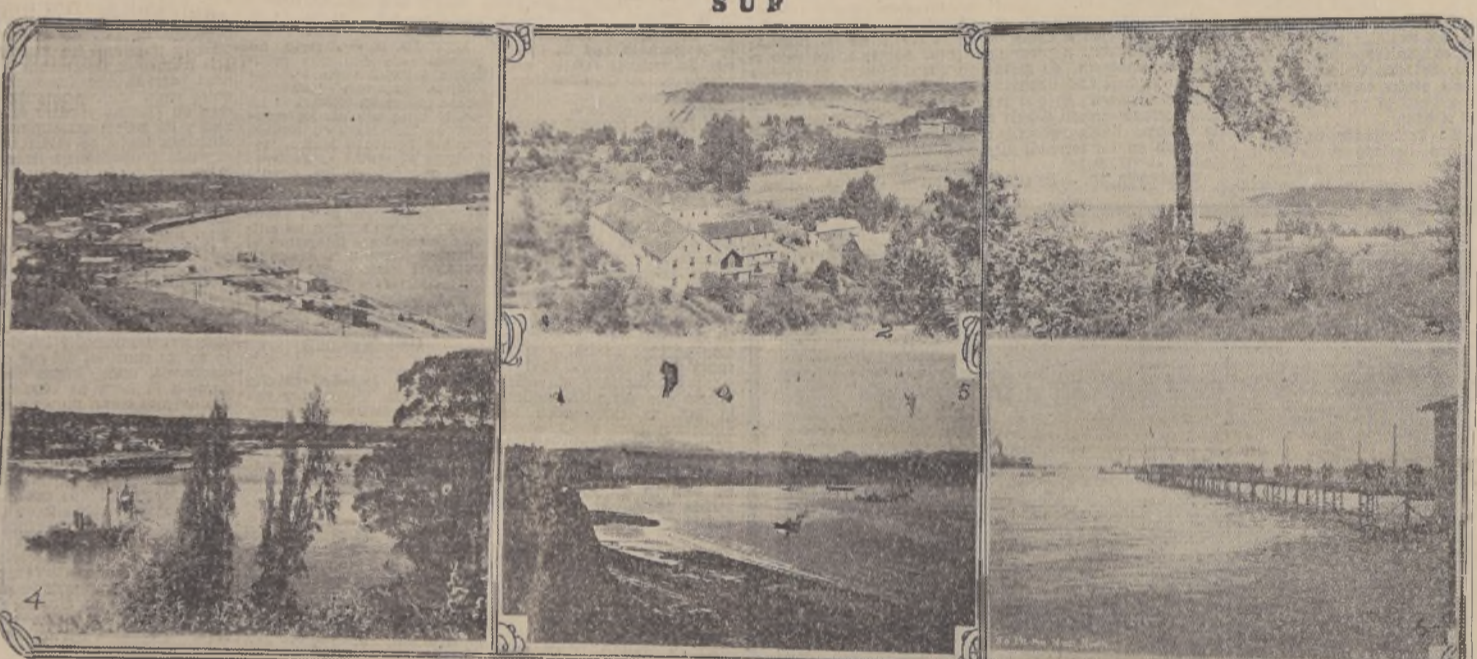
1. La Avenida Costanera de Puerto Montt.—2. Bahía, Isla y Canal de Tenglo.—3. Alrededores de Puerto Montt.—4. Puerto Montt visto desde Tenglo.—5. Amanecer en Puerto Montt.—6. El muelle