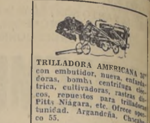
TRILLADORA AMERICANA con embudidor, nueva, enfardadora, bomba, centrífuga eléctrica.