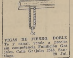
VIGAS DE FIERRO, DOBLE Te y canal, vende a precios sin competencia.