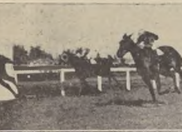
SITKA logra un fácil triunfo sobre Baldosa, Toronjo y Claridad

entregaron sin oponer resistencia... TERCERA CARRERA