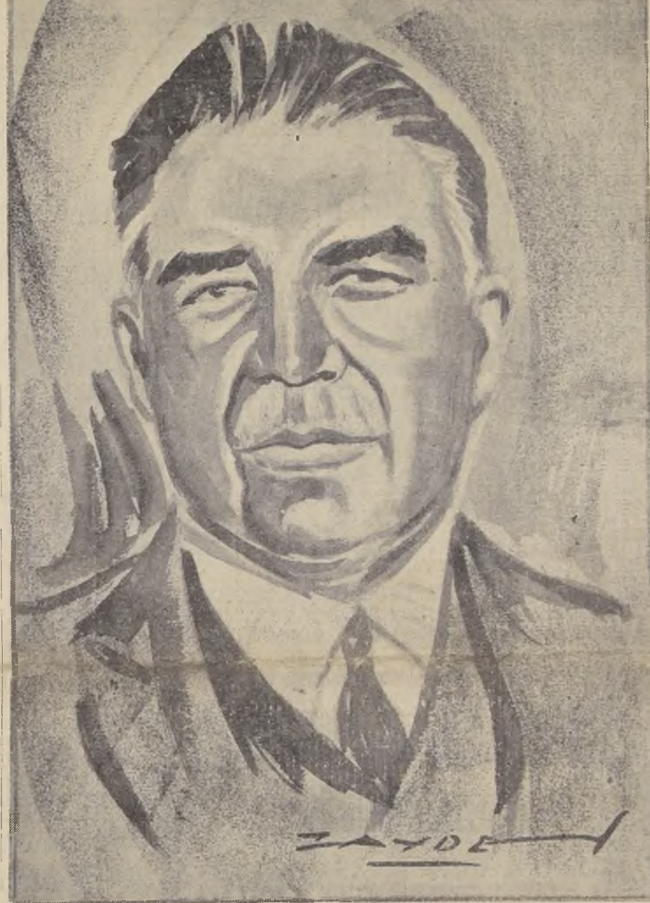
Don ENRIQUE VILLEGAS ECHIBURU

SU FALLECIMIENTO SE PRODUJO A LAS 11.07 P. M., EN UNA CLINICA DE LONDRES, DESPUES DE TODAS LAS TENTATIVAS QUE SE HICIERON POR SALVARLO. — EL DIRECTOR DEL SALITRE ENTRO EN AGONIA, PERDIENDO EL CONOCIMIENTO ALREDEDOR DE LAS 6 DE LA TARDE, DESPUES DE SER SOMETIDO A UNA DIFÍCIL OPERACION INTESTINAL