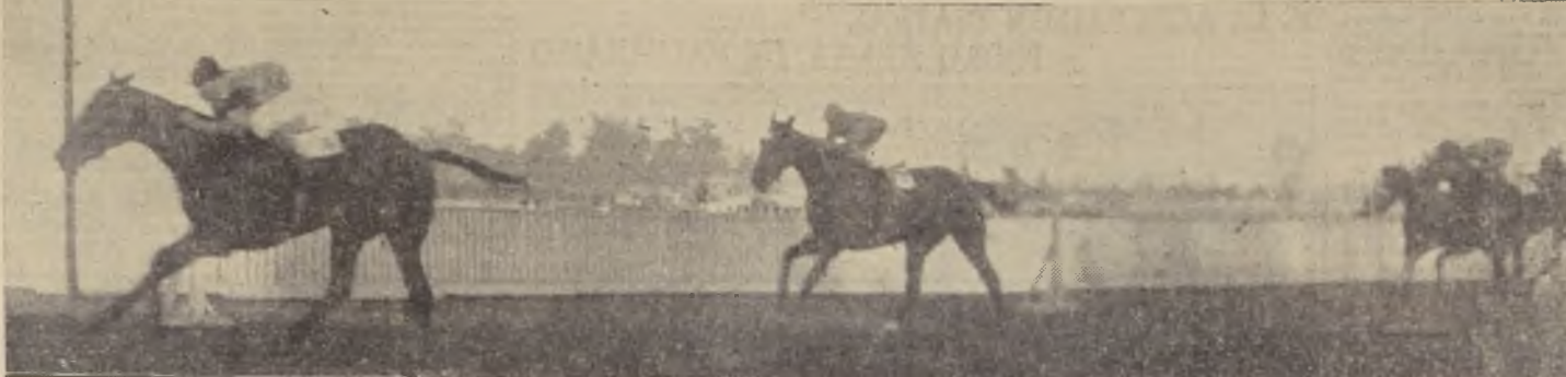
Castigador se impone fácilmente sobre Sirenia, Sharl y Sublime en el clásico Old Boy

Vina tarde verdaderamente pr... Se registraron varias sorpresas... Entre los profesionales actuó... Molulco, que ayer obtuvo su primer tiempo, jinete J. Molina.