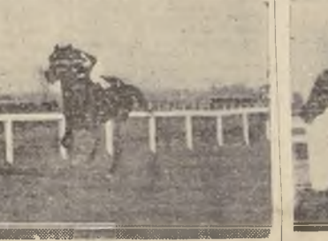
Flash, reaparece imponiéndose sobre Nevers, Retahilla y Saval

entregaron sin oponer resistencia... TERCERA CARRERA