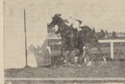
Molulco, derrotando Ferryboat y Mister Fife

Después de larga espera... Sin variantes se desarrolló la carrera... El ganador fue Castigador... Molulco, derrotando Ferryboat y Mister Fife