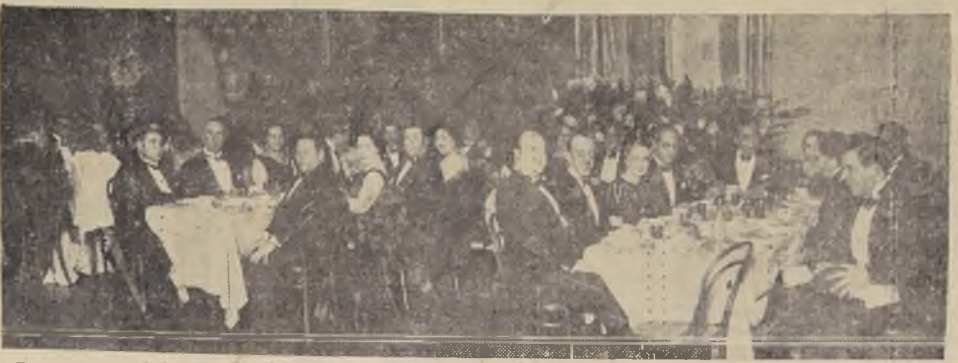
En el Círculo Español, comida oíllon, con asistencia del señor Embajador y señora y otras personalidades, Diplomáticos y altos dirigentes de la Colonia