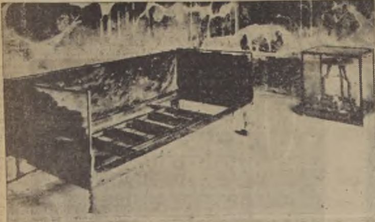
Cuarto de un romano: Recientemente excavado en la ciudad de Herculano. A la izquierda una cama de madera en perfectas condiciones. A la derecha, una mesa, también de madera, en la misma posición en que fue dejada por el morador de esta habitación en los momentos en que el Vesubio empezó a arrojar la lava, allá por el lejano y perdido año 79, antes de Cristo.