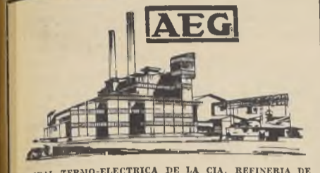
CENTRAL TERMO-ELECTRICA DE LA CIA. REFINERIA DE AZUCAR DE VISA DEL MAR. (Construida por la "A E G").

de esta ciudad extraña, múltiple, abigarrada. Ese ritmo arro- tra a todos en su órbita. Si que ha sentido una vez el latido de la vida berlina y le ha sentido de verdad, ya no puede aus- trarse a él. Y ya sea como mo- desta ruedecilla del ingente me- canismo o ya tenga la suerte de servir a la comunidad ese puesto director y responsable, todo ber- lina está orgulloso de serlo y convencido de que Berlín es, seguramente, una de las ciu- dades más hermosas y de las más interesantes que han exis- tido. Berlín es rico en tra- diciones históricas, rico en mo- numentos y rico en cosas mo- dernas y sorprendentes. El cora- zón berlina, por su parte, es rico en simpatía y en confianza, cualquiera que sea el rincón pa- trio donde se metió su cuna.