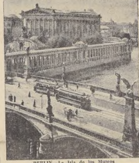
BERLIN—La Isla de los Museos