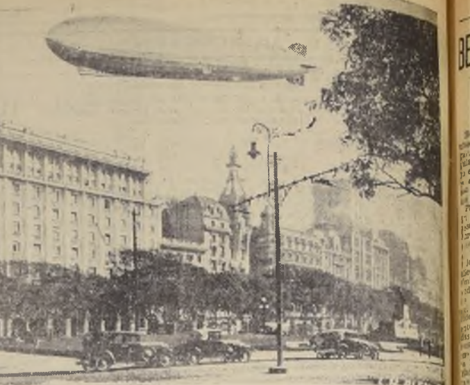
El "GRAF ZEPPELIN" en su reciente viaje a Buenos Aires, pasando por sobre el edificio del Banco Germanico