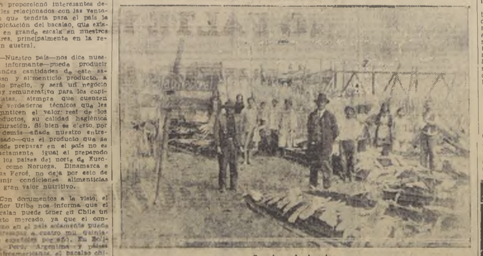
Secadero de bacalao