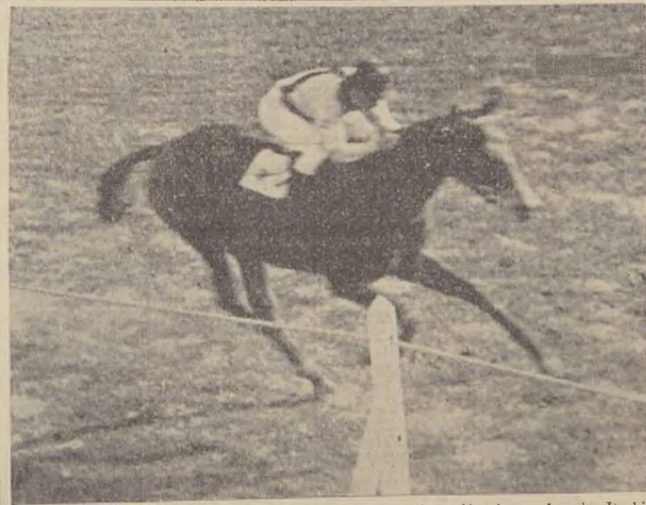
LLEGADA DEL CLASICO "INICIACION".—En cómoda acción el gran favorito Iturbide se adjudica el clásico Iniciación, disputado ayer en el Club Hípico

La prueba se resolvió lógicamente y el favorito se impuso de extremo a extremo por 5 cuerpos a Huesca, una media hermana de Heidenberg.