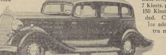
3" cilindros en línea—Cambios sincronizados