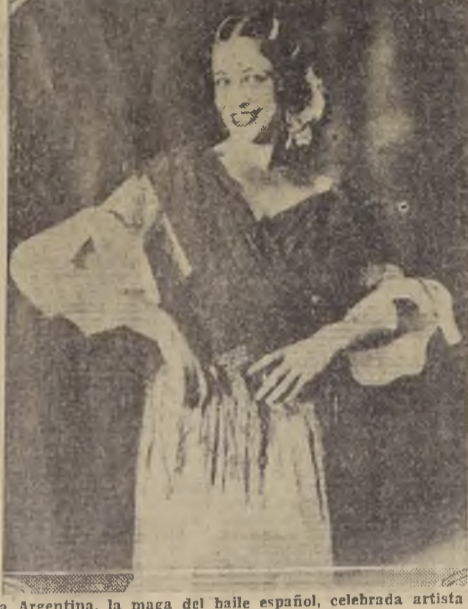
La Argentina, la maga del baile español, celebrada artista que ha entusiasmado a los newyorkinos

Ayer se nos ha confirmado en forma oficial la noticia de que la Sociedad de Conciertos Daniel, que este año nos ha permitido disfrutar de refinadísimos espectáculos musicales como los ofrecidos por