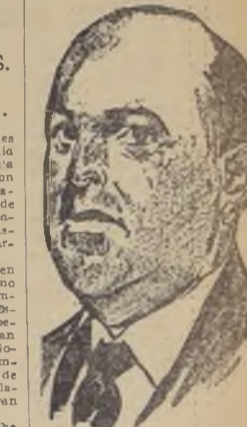
Salazar Alonso, Ministro de Gobernación española, que ha debido hacer frente a la rebelión de los municipios vascos.