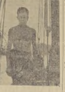
El famoso "navegante solitario", Allain Gerbault, que según noticias últimas, ha declarado querer convertirse en un "salvaje voluntario"

PARIS, 12. — (U. P.) — Informaciones llegadas a París del famoso navegante solitario Alain Gerbault dicen que este famoso personaje se encuentra en la actualidad en las Islas Marquesas a