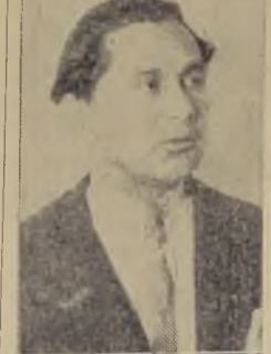
El Ministro del Trabajo, don Alejandro Serani.

Este Secretario de Estado concurrirá a la Convención de la Confederación Nacional de Sindicatos de Chile. — Finalidades sociales y económicas a que responde esta Central, y normas disciplinarias dentro de sus filias. — Peticiones en favor de problemas de los Sindicatos de Rancagua y Sewell, de los Obreros Ganaderos de Magallanes y Mollineros de Santiago y provincias.