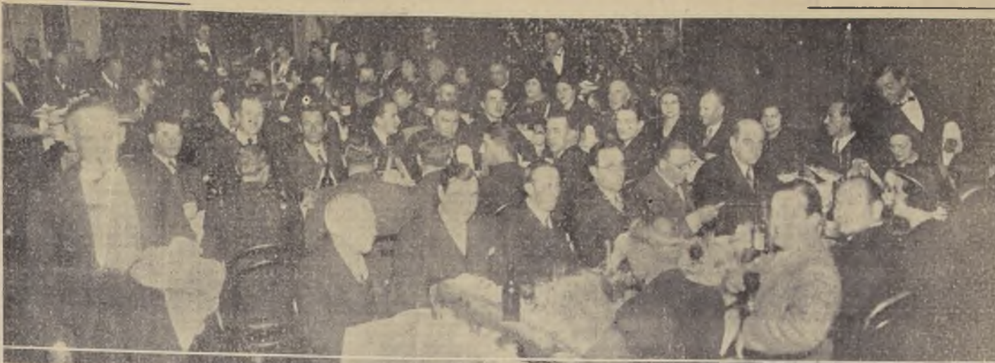
Asistentes a la comida que los socios del Circulo Español ofrecieron a los artistas señorita Paquita Madriguera y señores Federico García Sanchiz y Andrés Segovia con motivo de su visita a esta capital.