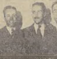
Equipo del Viroca C, que venció al National City Bank B.