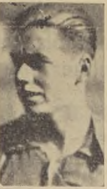
Asociación de Football de Santiago