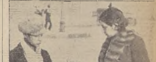
Flores... En las inmediaciones de los Mercados, la venta de flores tiene clientes cotidianos.—Después de recorrer la Vega, entre montones de carne y zanahorias, bien vale comprar un ramo.

La política de progreso que se ha implantado en el Mercado Central ha tenido saludables repercusiones en el aumento y desarrollo de las actividades, nos dicen.