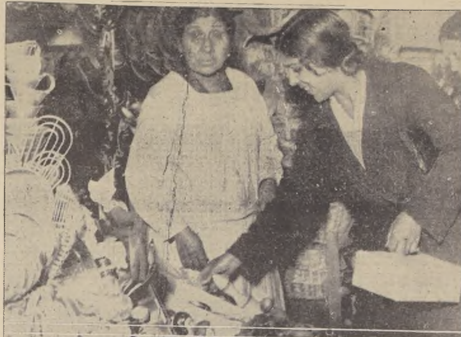
Esta señora explota el comercio de baratijas: desde zapatillas para levantarse hasta muñecas con cuerpecito de trapo.—Vemos en el grabado a una mamá joven que, después de comprar unas zapatillas para ella, compra para su chico.

Se calcula que, en la actualidad, se hacen allí transacciones por más de doscientos mil pesos diarios. El número de comerciantes establecidos en el sube de quinientos, la mayoría de los cuales han venido atraídos por las facilidades que otorga la Municipalidad.