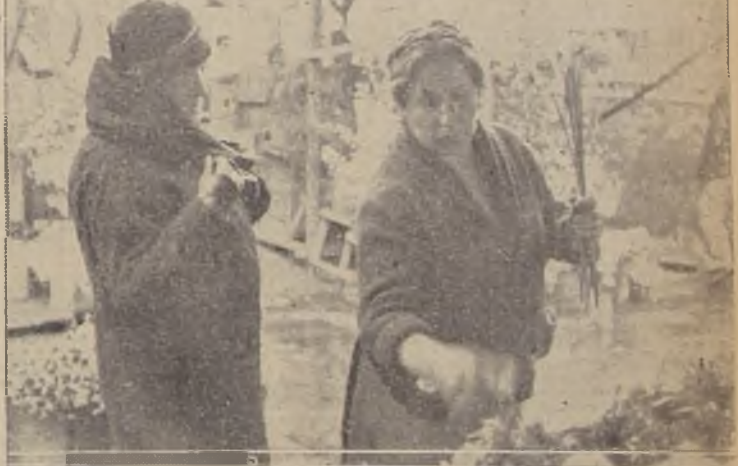
Tulipanes... ¿Para quien? Pueden ser para la Virgen, o para adornar la mesa... Mientras tanto, bajo el sol de invierno, las flores muestran la gloria de sus cálidos brillantes de rocío.

—La Municipalidad — nos dijo — tiene estudiado ya el proyecto a que ustedes se refieren, y consulta: la demolición de la actual Vega Central, para construir un nuevo mercado que llene todas las condiciones de capacidad y comodidad para el público en el lugar donde actualmente funciona la Feria, en la ribera norte del Río Mapocho, para proveer a todo el centro y barrios de Independencia, Recoleta, Purísima, etc. Un segundo mercado en los locales que ocupaba el Tattersall, en las inmediaciones de la Estación Central, que contaría con espléndidas instalaciones frigoríficas para el expendio, en grandes cantidades, de pescado, huevos y otros productos semejantes destinados a abastecer el barrio poniente; el tercer mercado, en donde actualmente se encuentra el maderero, en la calle Franklin, ampliando las instalaciones que hay actualmente, y el cuarto mercado, se encontraría en Vicuña Mackenna esquina de Días de Julio, para atender todo el sector oriente de la ciudad, barrios Atos, etc. El plan que ha elaborado para este efecto el Municipio consulta todas las necesidades de la ciudad.