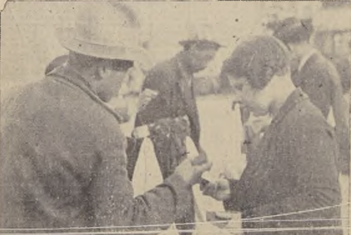
No falta, en medio del bullicio del Mercado, el que vende "pasadores dobles", PINCHES para el pelo y GANCHITOS para el cuello.—Es el COMERCIO abigarrado de las calles adyacentes, que ofrece una nota bulliciosa y pintoresca.

tan íntimamente ligada a las necesidades domésticas, el hogar, a las actividades de la dueña de casa. Nuestra ciudad, que tiene ya cerca de un millón de habitantes, cuenta sólo con cuatro mercados, y éstos están siempre llenos. La gente avanza por entre las pilas de verdura, de fruta, los puestos de flores, las carnicerías y las ollas de fritangas, haciendo la compra diaria, escatimando los precios, discutiendo a gritos. Sin duda, todo esto lo hace pensar a uno en los mercados árabes, donde se disiente toda la mañana antes de llevar a un caballo flaco y con los dientes de dudosa firmeza. Aquí, las señoras y los comerciantes disputan por una media docena de cebollas, por un repollo, por un ramillete de zanahorias. Todo es cuestión de unos centavos. Ella quiere la economía máxima. El, la ganancia máxima. Filosofía humana, por cierto. Pero que cada cual ve desde su punto de vista, sin ceder hasta la última instancia.