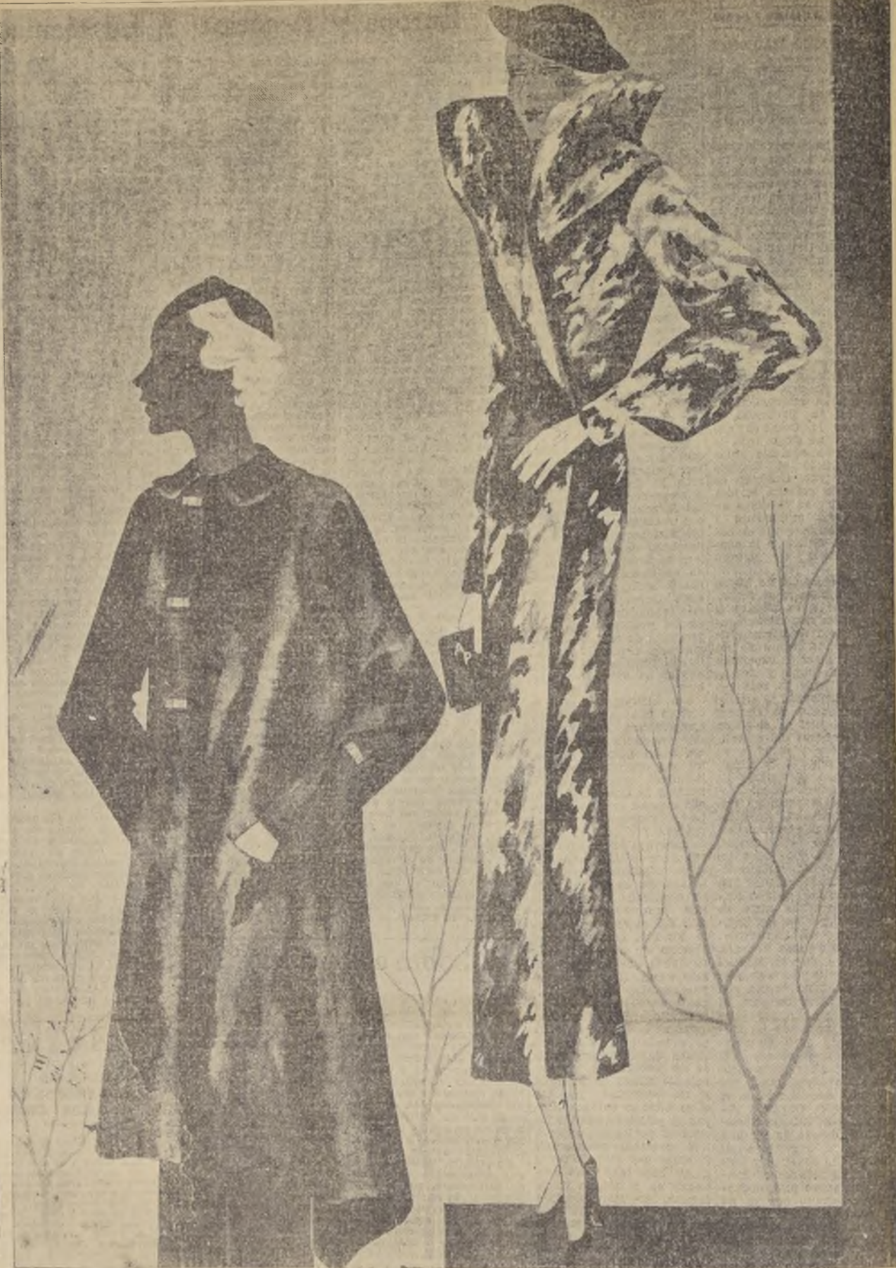
REVILLON "OVUANA". Abrigo de nutria o "ragoulin"