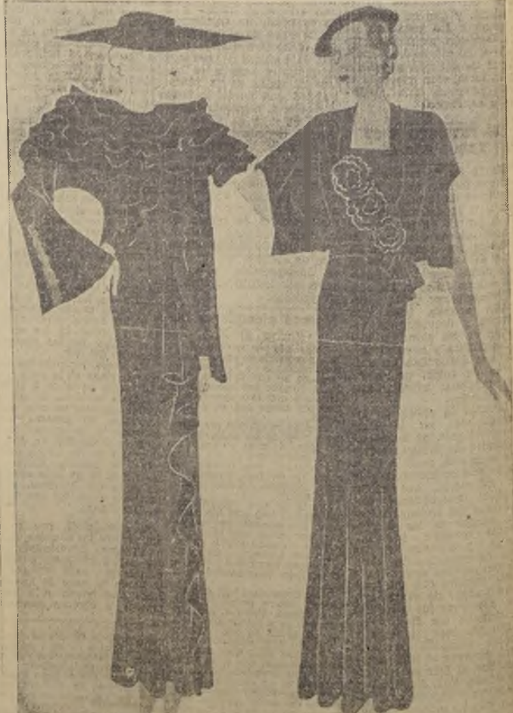
Vestido para "cocktail" de Molyneux, de Vestido de "crepe cloqué" negro; flores de "crepe" negro y muselina "crepe" negra