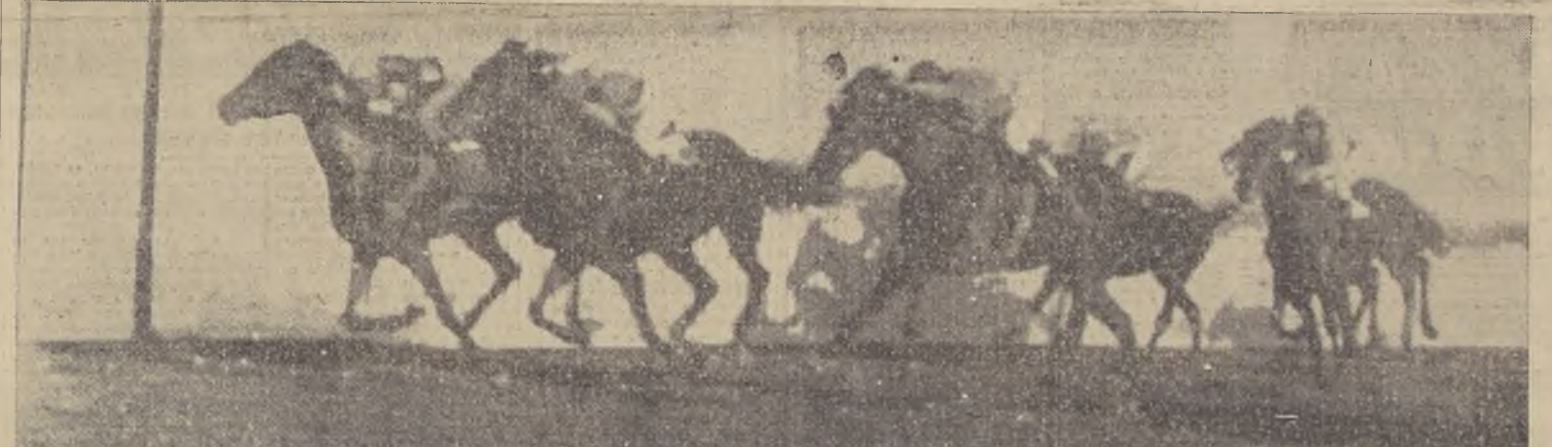
LA LLEGADA DE LA PULLA DE POTRILLOS.— En postrer esfuerzo el favorito Vitelio consigue batir a Gran Emir por 1 pescuezo, tercero a 1/2 cuerpo Koenigsmark y 4.º Iturbide

En la siguiente forma: a los pellos Haviland y a continuación Punto, Eminenté, Tiburón, Koenigsmark, Iturbide, Aderex, Gran Emir, y Ripley por el lado de adentro.