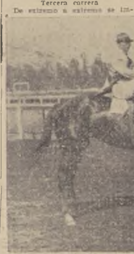
Etoile, por Maidstone y Lady Gay, que ganó su primera carrera. Jinete: R. Pérez

El tercer lugar, a 1 1/2 pescuezo lo ocupó Penzance, delante de Forlida; 5.º Saltamonte; 6.º Falsantúa y último Saltón.