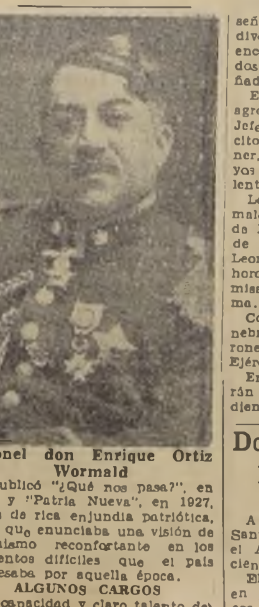
Coronel don Enrique Ortiz Wormald

Las letras fueron brillantemente cultivadas por el Coronel Ortiz, quien logró cimentarse un bien ganado prestigio por su estilo vibrante y nervioso. El año 1908, con el seudónimo de Espinal Henry, publicó su primer libro, "Cuestiones 1925", en 1927, pertenencia. 88 años de "Fascismo", libro de rica enjundia patriótica. Más tarde, abordando el mismo tema, publicó un nuevo e interesante volumen, "La Guerra", que momentos difíciles que el país blico y en la crítica, que lo acompañó con entusiasmo. Sucesivamente