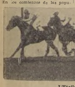
L'ETOILE, delante de Paracelso y Magazine

Después de corta espera funcionaron las cintas y Quillol Quillol se destacó al frente, quedando segundo Miguelito con poca ventaja sobre Huesca, Spear y los otros agrupados con El As y Little Pool en los últimos lugares.