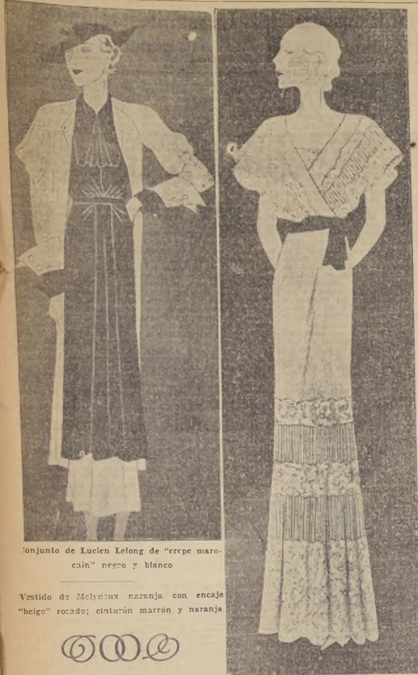
Conjunto de Lucien Lelong de "crepe marocain" negro y blanco