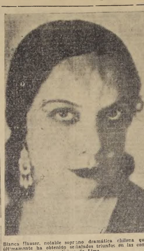
Blanca Hauser, notable soprano dramática chilena que últimamente ha obtenido señalados triunfos en las conjuntas líricas de Lima

Amé a una mujer. (Para mayores, no recomendable para señoritas).