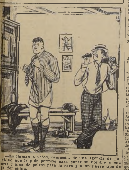
—Llaman a usted, campeón, de una agencia de publicidad que le pide permiso para poner su nombre a una nueva marca de polvos para la cara y a un nuevo tipo de ropa femenina.