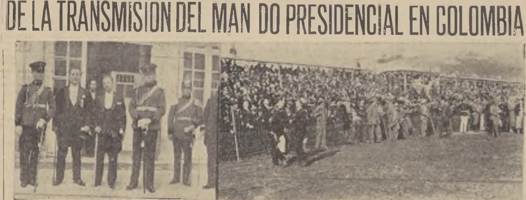
A la izquierda, un aspecto de las tribunas del campo militar en que se verificó la gran revista militar, con motivo de la ascension del señor Alfonso Lopez a la Primera Magistratura de la nación. — A la derecha, la Embajada Especial de Chile a la transmision del mando, acompañada del Encargado del Ceremonial Diplomático.