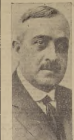
Excmo. señor Joaquín Pedroso