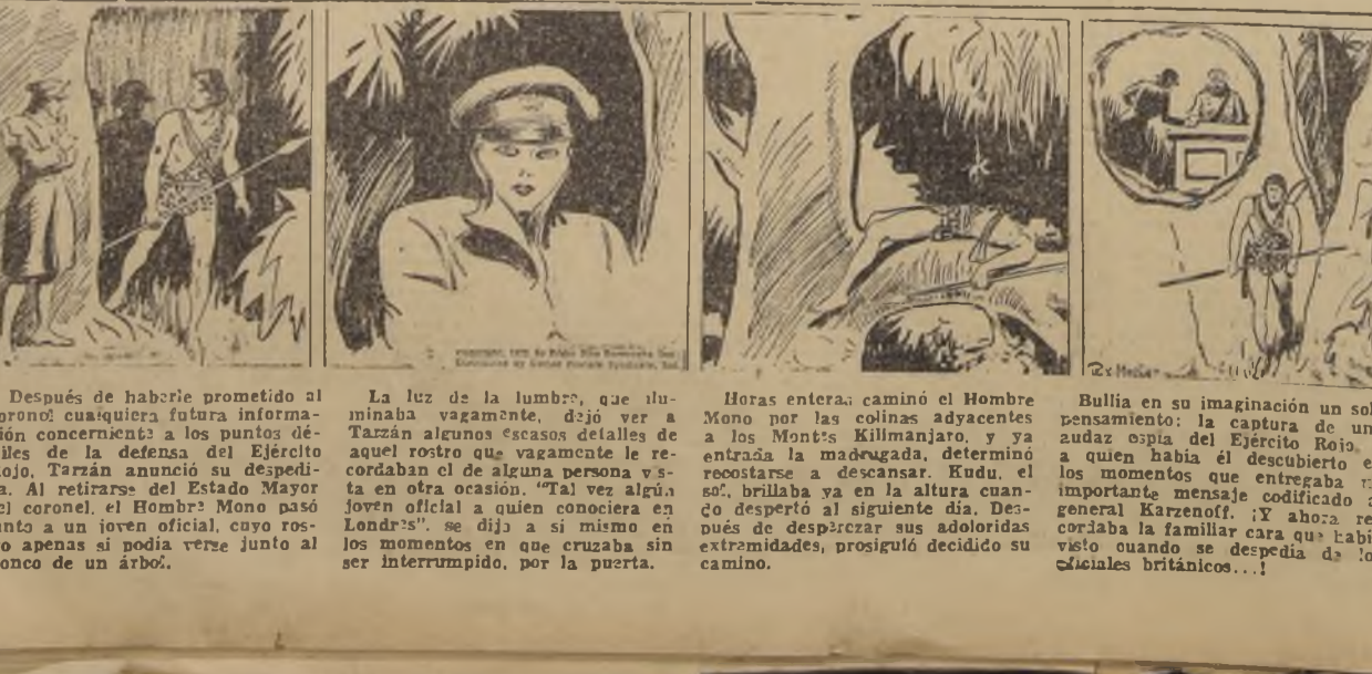
Después de haberle prometido al coronel...