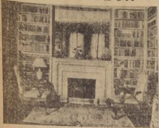
Aquí podemos ver un rincón de living-room, donde va colocada la chimenea y biblioteca. Dos confortables sillones sobre un hermoso tapiz persa. Completa el decorado de la chimenea un gran espejo de cortas originales.