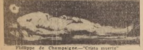
Philippe de Champagne. — "Cristo muerto"

Salvo los Independientes, todos esos grupos admiten sus cuadros por decisiones de jurados, cada