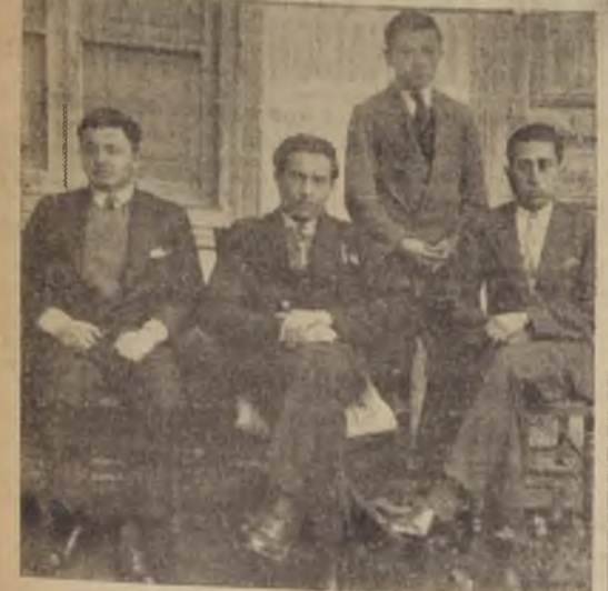
El personal de la Caja de Ahorros de Salamanca