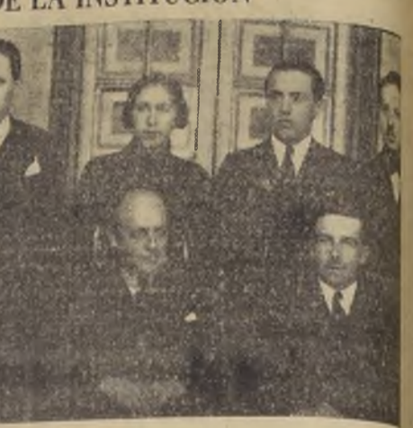
El personal de la Caja de Ahorros de Rengo. Sentados: abogado, don...