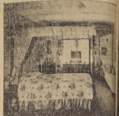
Para una sala muy iluminada aconsejamos este color azul "Delphinium", como fondo mural. El padre estilo "Chippendale", lleva cortinajes de gasa color oro, combinada con una cretona encendida para el cubre-cama. Un confortable sofá con su cojín de va cubierto de una hermosa tela cruda con pequeños ramilletes de campo. Alfombra oscura y sencillos muebles de época completa el dormitorio de juveniles.