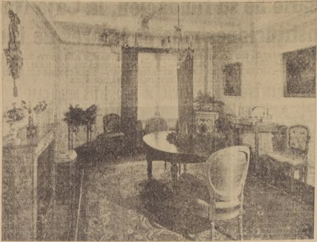
Este comedor de estilo netamente francés está muy armoniosamente amoblado con una inteligente combinación de la época de los Luisas. Los sencillos muros realzados por una pequeña "boiserie" están pintados al óleo en un color crema oro, algo atenuado por un patinado de cera.