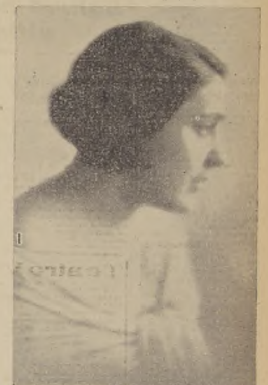
Nella Giudetti, soprano lirico

eminentemente maestro—de poder colaborar en la brillante temporada que se inicia mañana, gracias a los esfuerzos de la Empresa Pascual Camino. Es para mí una gran satisfacción venir a esta ciudad, cuyo prestigio en el exterior, corre a paralelos con el de las más importantes capitales. Estoy seguro de que aquí hallaré grandes satisfacciones artísticas, pues sé de sobra cómo aprecian cualquier manifestación de esta índole. Contribuiré en la mejor forma al desarrollo de la temporada, y puedo asegurarles que siento una intensa satisfacción ante la idea de afrontar la