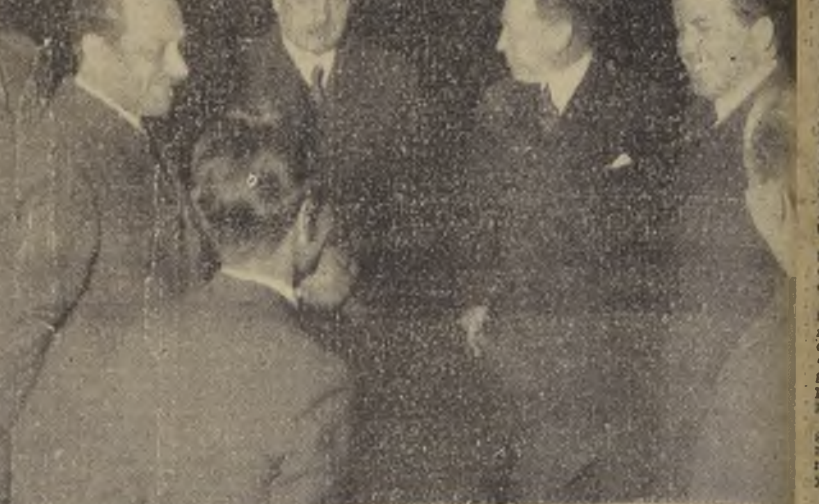
Los profesores argentinos con el Director de 'La Nación', durante su visita de ayer

EL CONCIERTO DEL TEATRO MUNICIPAL. Como hemos informado anteriormente, este gran concierto estará a cargo de los establecimientos de enseñanza secundaria y de la Escuela Normal N.º 2 de Niñas.