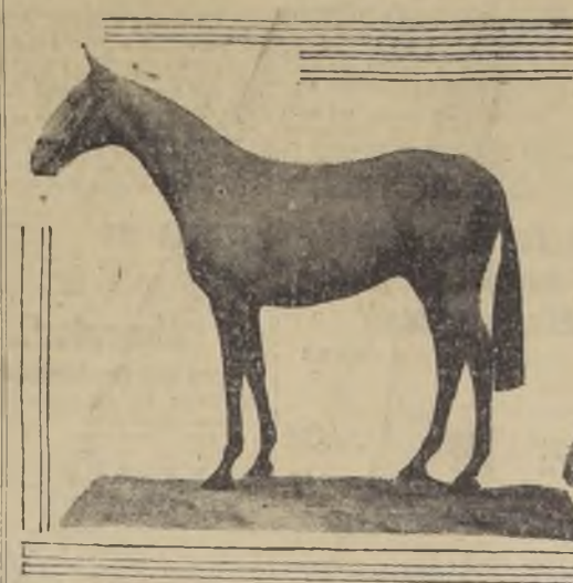
Helesponto fué adquirido para Venezuela. En la suma de $ 25.000 ha sido adquirido últimamente el caballo Helesponto...