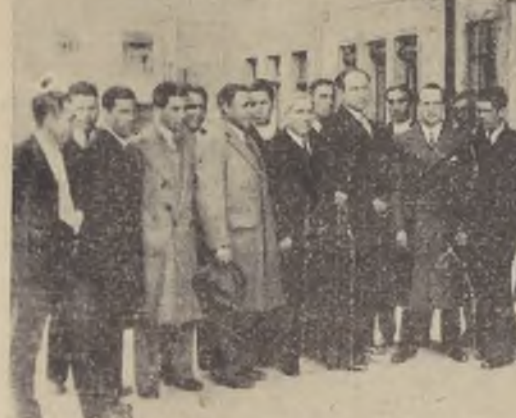
La delegación ferroviaria, en su visita de despedida que hizo a "La Nación"