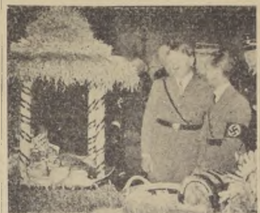
A. Hitler y el Dr. Goebbels contemplan alegres los regalos que hicieron al Reichsführer los campesinos alemanes el día de la cosecha.

ble establecer, por primera vez, desde antes, el mercado de patatas. La venta callejera de los emblemas tuvo éxito similar. Más de quince mil patatas de familias fueron ocupadas solo en esta venta, mientras que la fabricación de los diversos emblemas, flores artificiales, etc., proporcionó trabajo a muchos otros miles más principalmente en las regiones más afectadas por la desocupación. Estas son las que se dedican a la confección de flores artificiales, etc. Sigue aún con mucho éxito todos los domingos, la venta de las llamadas "rosas blancas" flores de encajes blancos. El mundo femenino las compra preferentemente porque de ellas se pueden confeccionar hermosos labores de mano. En claro que varios otros ramos participaron del beneficio debido a la movilización y distribución de las enormes cantidades de especies referidas a los indigentes, en especial los ramos del tráfico y otros similares.