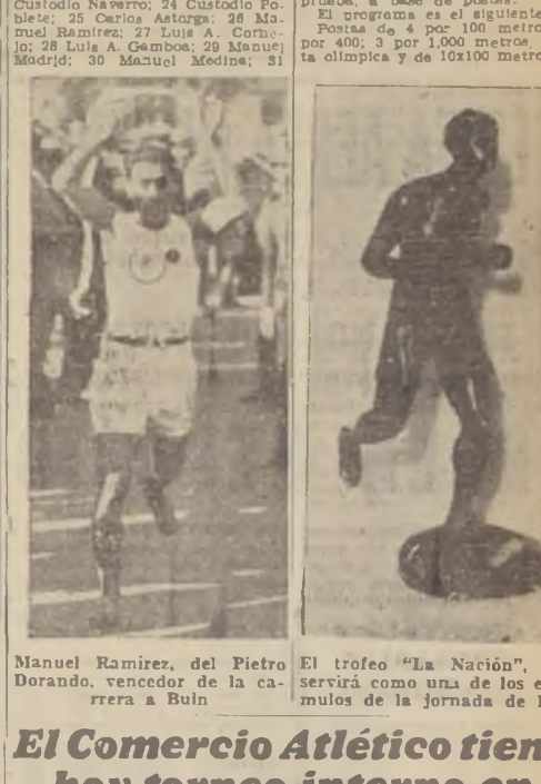
Trofeo "Presidente Alessandri", que se disputará hoy por primera vez