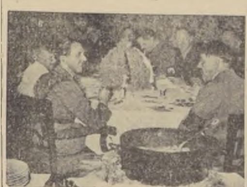
El "Domingo del Puchero" en la Cancillería del Reich.

MEDIAS, CALCETINES, CORBATAS, PAÑUELOS. EL MAYOR SURTIDO Y LOS PRECIOS MAS BAJOS, EN LA REINA DE LAS MEDIAS. AHUMADA 360, SANTIAGO. PIDA UN LISTA DE PRECIOS.