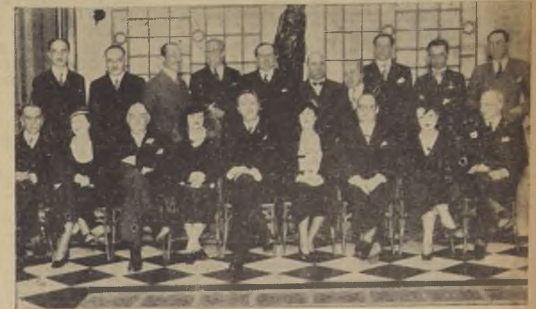
Banquete ofrecido por la delegación argentina al Congreso de Educación, retribuyendo atenciones al señor Ministro de Relaciones Exteriores, don Miguel Cruchaga Tocornal.