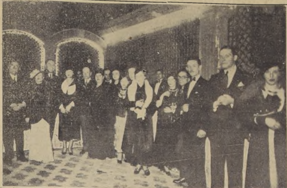
Uno de los grupos de los concurrentes a la recepción ofrecida anteaer por el Embajador Cienfuegos, en el palacio de la Embajada.