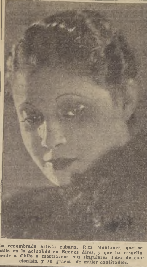
La renombrada artista cubana, Rita Montaner, que se halla en la actualidad en Buenos Aires, y que ha resuelto venir a Chile a mostrarnos sus singulares dotes de cancionista y su gracia de mujer cautivadora

Don Ramiro de la Presa, el distinguido periodista cubano que nos visitó hace poco en calidad de asesor literario de la compañía española de revistas Alegria-Enhart, y que se halla actualmente en Buenos Aires con el citado conjunto, nos ha enviado una extensa carta, en la cual, después de hacer los más gratos recuerdos de su permanencia en nuestro país, al que piensa volver en cuanto le sea posible, nos informa, con lujo de detalles, sobre el movimiento de teatro que ofrece la capital argentina en estos momentos. Pero la noticia de mayor calibre que nos comunica este buen amigo de los chilenos es que Rita Montaner, la famosa cancionista habanera que ha actuado este año con éxito formidable en las ciudades del Plata, está próxima a salir con rumbo a nuestro país, para debutar en Valparaíso y continuar una gira por los países del Pacífico. Hace poco más de dos meses fuimos los únicos en informar al público santiaguino acerca de los triunfos que venía obteniendo en Buenos Aires esta celebrada artista cubana, que hoy goza de un bien cimentado prestigio en las grandes capitales de Europa, como París, Madrid, Londres y Berlín, donde nuestro redactor teatral tuvo oportunidad de presenciar los éxitos y aplaudirla hace tres años. Para los que todavía no la conocen del todo, diremos que Rita Montaner tiene una página de honor en los anales del arte típico ibero-americano, por haber