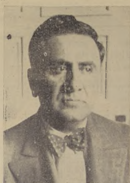
Sr. Vicente Rivarola, Ministro del Paraguay en Argentina

NEUVA YORK, 17.— La Bolsa de Valores, cerró irregular y con poco movimiento. Las acciones de compañías mineras de plata cerraron firmes. El trigo, cerró con alza de un centavo, el algodón con alza de cincuenta centavos. La libra esterlina cerró a 5.01. Las ventas alcanzaron a un total de 650.000 acciones. — (U. P.)