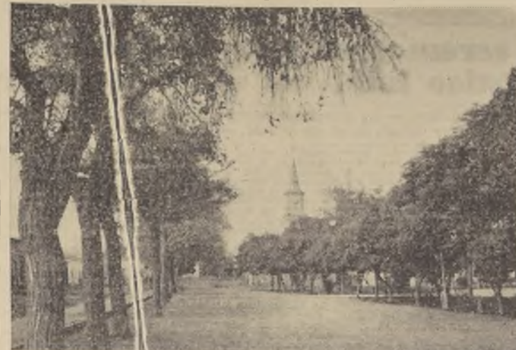
Un aspecto de la Plaza de Ovalle.