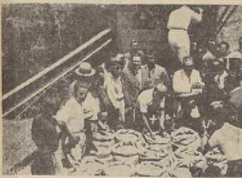
El Duce participa en la trilla del primer trigo de Littoria (Sabaudia), junto con los campesinos.