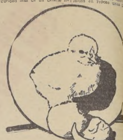
La selección cuidadosa de los huevos, dará como resultado pollos vigorosos.

El hecho de que en los huevos haya diferencia de color y tamaño, es debido a las distintas razas de que proceden. Se tendrá un nacimiento parejo de pollos, si se eligen huevos de una sola raza. En primavera, cuando las aves están en postura, es cuando el huevo alcanza su mayor peso, se acepta como normal para la incubación si pesa 56 gramos. Hemos recibido los Nos 1 y 2 que contienen interesante material de lectura a la vez que noticias muy importantes para sus socios.