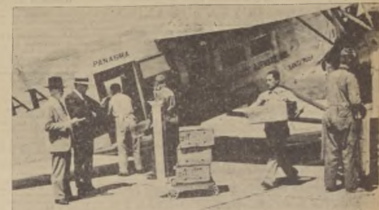
Durante el embarque de los 1.230 kilos de langosta, en Los Cerrillos

1.230 kilos de langosta fueron enviados ayer en avión a Buenos Aires