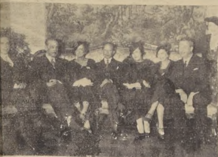
Grupo de asistentes a la recepción ofrecida ayer por el Ministro de China, con motivo del aniversario de esa República.