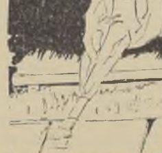
Hoy, a las 15 horas, en el Jardín de saltos del Santiago Paperchase Club (Tabolaba), se dará comienzo al gran concurso hipico que hemos venido anunciando y que continuará mañana y el domingo a la misma hora.

—¿Qué piensa de la música chilena? — La música chilena está representada por un reducido grupo de compositores. Les tonadas del país son características e inconfundibles. — De todos los géneros, ¿cuál prefiere? — El género dramático; desde el madrigal dramático, hasta la ópera.