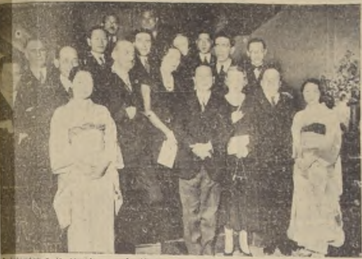
Asistentes a la comida que ofreció el Ministro del Japón a un grupo de sus relaciones