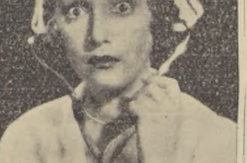
¿Qué le pasa a Bebe Daniels? Marcha mal el funcionamiento de ese corazón que han tratado de conquistar tantos astros de Hollywood?

—¿Cuáles son sus obras? — Un Trio, en forma de sonata; una Suite, para orquesta de cuerdas; una Gita, para piano; dos melodías; un madrigal; varios estudios para piano y una Ave María, para soprano y orquesta, que dirigí el año 1930. Fue mi primer trabajo. Este ensayo me ocasionó enormes sufrimientos, pues me alicieron y tiñicullaron por haberme atrevido a concertar y dirigir una producción mía, siendo mujer.