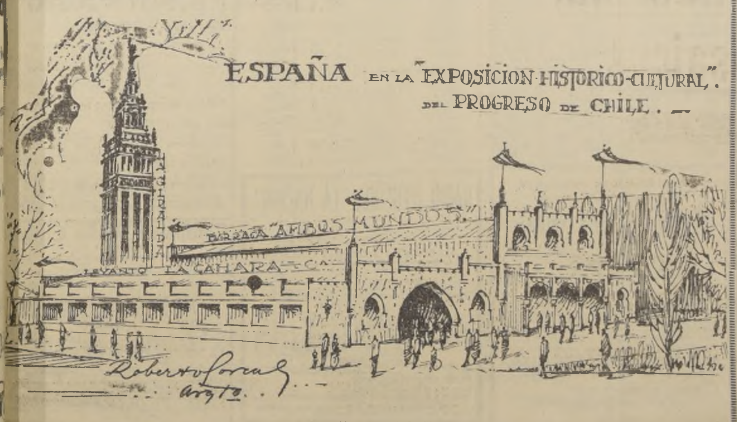
PABELLON ESPAÑA, de estilo morisco, con una reproducción exacta de la Giralda de Sevilla, en el cual la Colonia Ibérica revelará el esfuerzo de su Industria y de su Comercio en favor del progreso de Chile.