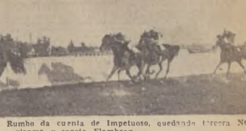
En emocionante final, Buen Rumbo da cuenta de Impetuoso, quedando tercero Neuvienme, y cuarto Flambeau