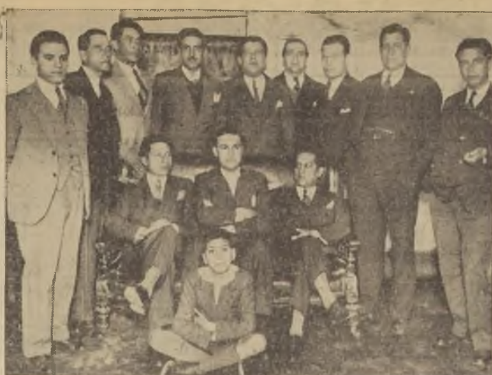
Actual directorio de la Sociedad Unión de Peluqueros, progresista y abnegada...