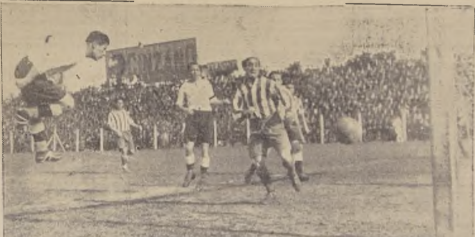
Un buen cabezazo de Aurelio González pone en serio peligro el baluarte argentino.