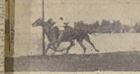
En emocionante final, Buen Rumbo da cuenta de Impetuoso, quedando tercero Neuvienme, y cuarto Flambeau