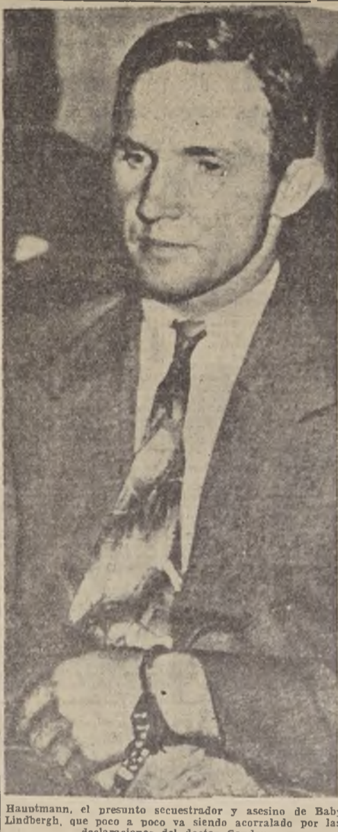
Hauptmann, el presunto secuestrador y asesino de Baby Lindbergh, que poco a poco va siendo acorralado por las declaraciones del doctor Condon