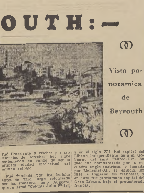
Vista panorámica de Beyrouth

ATALÁ HNOS. PAQUETERIA AL POR MAYOR. El más completo y novedoso surtido