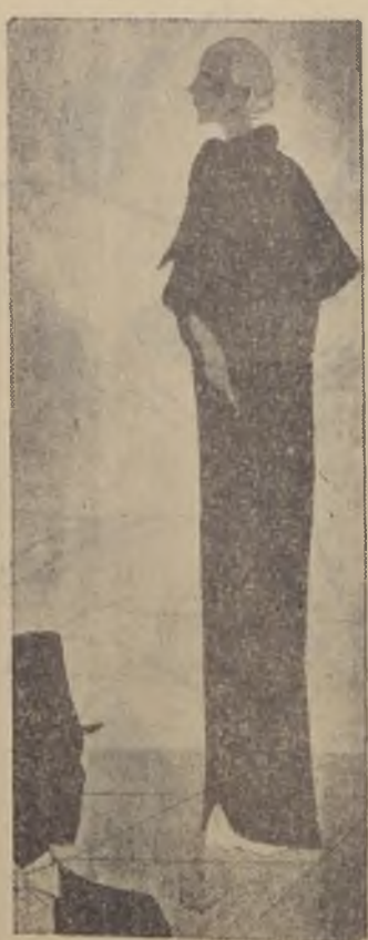
Abrijo de noche de terciopelo "free-bark" (corteza de árbol) verde ónice, con pequeña capa de Schiaparelli

—Hola, Tim-Tom, parece que te encuentras en apuros? —Era su abuelita, la anciana Ramona, que así le hablaba. —¿I contestó la ranita con voz de lobo.