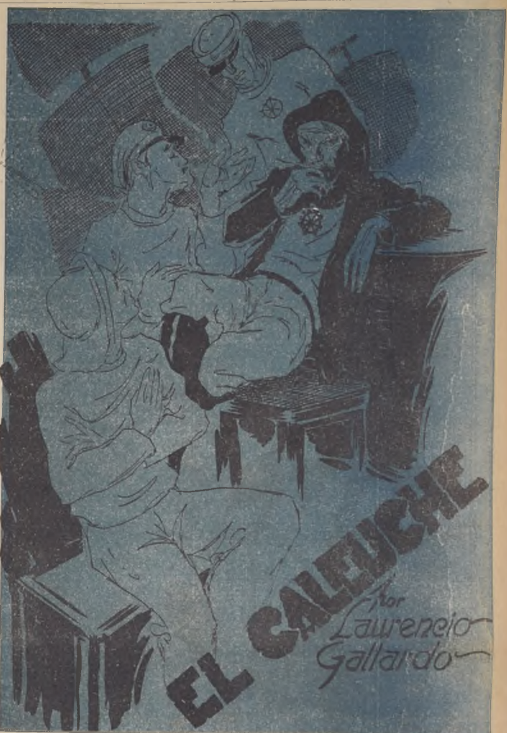
por Laurencio Gallardo

El desenfreno a que se entrega la muchacha después del espantoso asesinato de sus padres no tiene límites ni reconoce fronteras morales. Violette no se ocultó nunca, ni mantiene en secreto su identidad. Continúa bebiendo "copetines" y bailando con sus amigos con absoluta inconciencia. No debía ignorar que la policía, naturalmente, la buscaba con empeño. Un muchacho de 21 años, estudiante de derecho, conoce algo del crimen, y la denuncia caballerescamente en la comisaría, después de vivir con ella y de recibir dinero de Violette. ¿Por qué no se ocultó? ¿Inconsciencia? Si. O, mejor dicho, ausencia absoluta de la voluntad, en cuanto no se trata de realizar la idea fija. Y la idea fija, la obsesión, consiste en divertirse, beber y bailar, como ha bailado con un negro en Tarabin media hora después de haber asesinado a su padre. El delator ofreció a un diario parisiense explotar en sus páginas la nota sensacionalista, mediante una retribución, pero recibió de su director una rotunda y digna negativa. Era una infamia más de quien después de haber compartido el lecho con la asesina y la denunciaba a la policía, pretendía ahora enlodar con otra infamia la honestidad periodística. Tal es en síntesis, la trágica y dolorosa historia de Violette Nozières, la joven y bella francesa, despreocupada y alegre, a quien la jus-