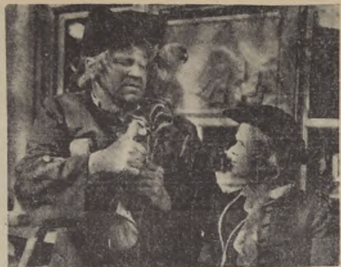
He aquí una escena de la película "LA ISLA DEL TESORO", basada en la novela del mismo nombre, del escritor Robert Louis Stevenson. Wallace Beery, Lionel Barrymore y Jackie Cooper son los principales intérpretes de la cinta.