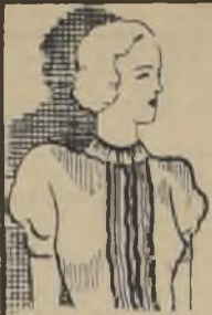
CHOMBA DE LANA