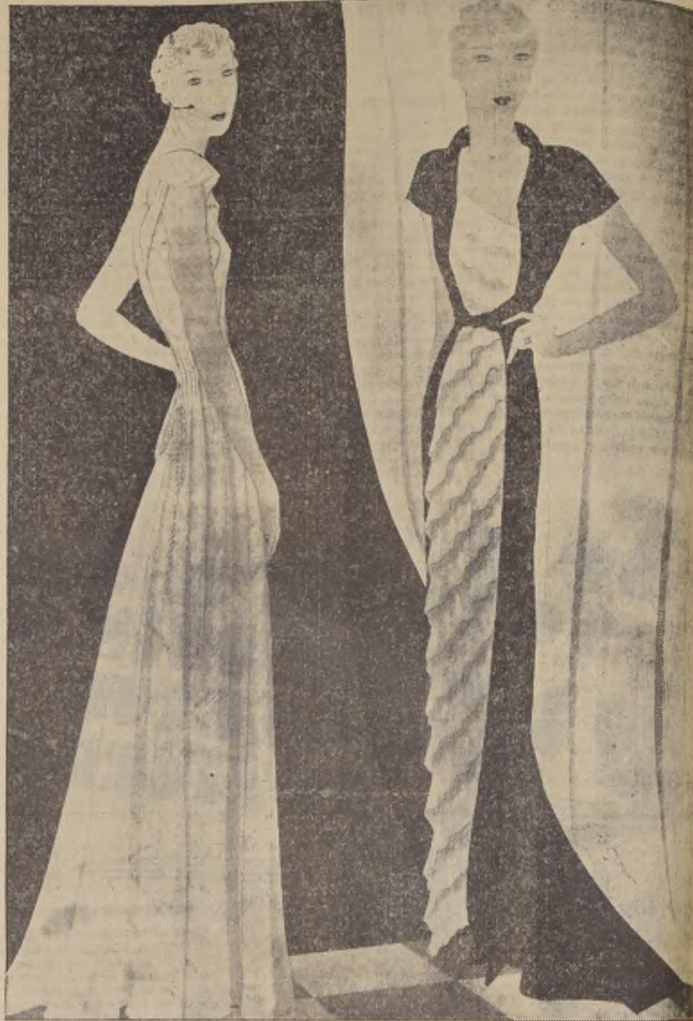
Vestidos de noche de SCHIAPARELLI: uno de "lamé" claro, ajustado al talle con un cordón, formando anchos pliegues en la parte posterior. Otro, de terciopelo "gran tenue", que abre sobre un delantero de ensaje plegado