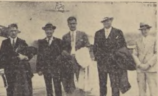
Los turistas norteamericanos que llegaron ayer