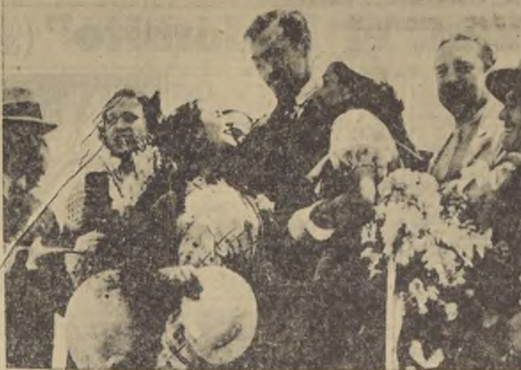
Primo Carnera, poco después de llegar a Buenos Aires y desembarcar del avión de la Pan American Airways, que lo llevó desde Río Janeiro hasta la capital argentina. Lo esperaban algunas hermosas muchachas de la Colonia Italiana.