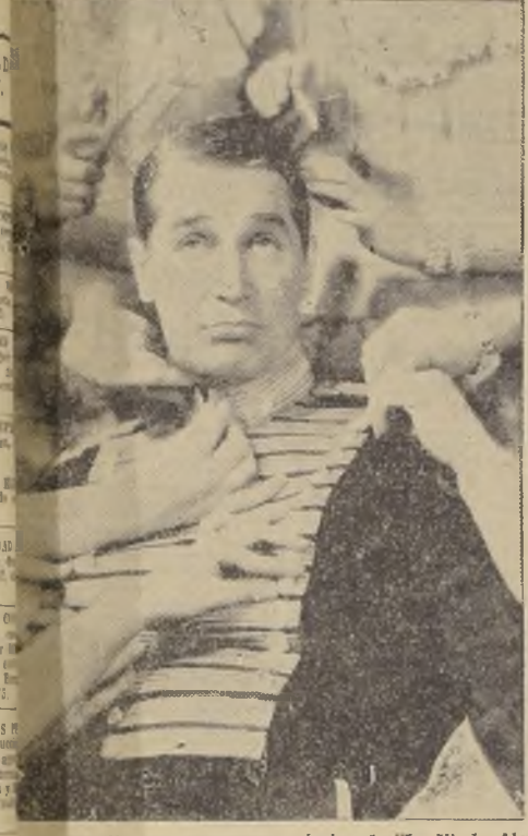
Maurice Chevalier en una escena cómica de "La Viuda Alegre" que está filmando para la Metro Goldwyn Mayer

La "Viuda Alegre", que ha rodado la Metro-Goldwyn-Mayer, en la interpretación de Maurice Chevalier y Jeanette MacDonald, se transmitirá por radio a todas partes del mundo. La Estación Difusora Bayer, ex Universo de acuerdo con la Gerencia de la Metro-Goldwyn en Chile, retransmitirá a su vez este concierto, a la par con Nueva York, mañana domingo 11, a las 10 horas (hora chilena). La fotografía que ilustra estas líneas pertenece a Maurice Chevalier, viajado de Príncipe Danilo, en la interpretación de este gran film que será dado a conocer entre nosotros en la próxima temporada.