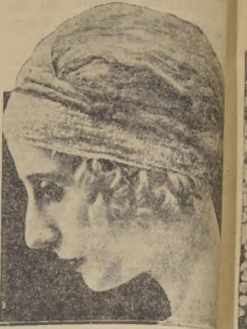
Ana Pavlova, la más grande bailarina de los últimos tiempos, cuyo genio coreográfico se perpetuará a las generaciones venideras mediante un monumento que se erigirá a su memoria en el Regent's Park de Londres.

LA GENIAL BAILARINA RUSA, FALLECIDA HACE TRES AÑOS