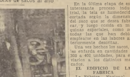
UNA COPA DE CHAMPAGNE. Terminado el acto de inauguración, los invitados pasaron a la oficina de la Gerencia de la Fábrica.