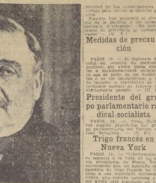
M. P. Etienne Flandin