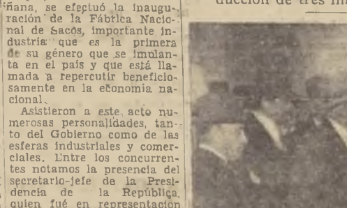
El Ministro del Interior, el Ministro de Hacienda y otras personalidades, en la inauguración de la Fábrica de Sacos.

Al acto de inauguración concurren distinguidas personalidades del Gobierno y de las esferas comerciales. La nueva industria constituye un valioso aporte en favor de la economía nacional.