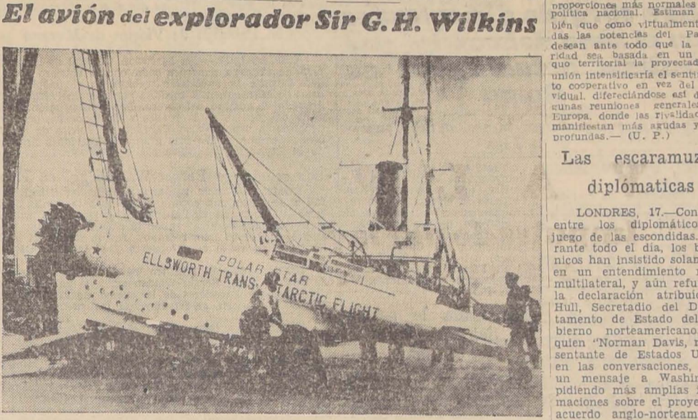
El aeroplano construido especialmente para la expedición del capitán Wilkins...