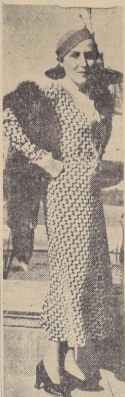
La artista argentina Berta Singerman, que recitará en la noche...