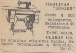
MAQUINAS "SINGER" desde $ 300 entragamos pagaderas $ 40 mensuales.