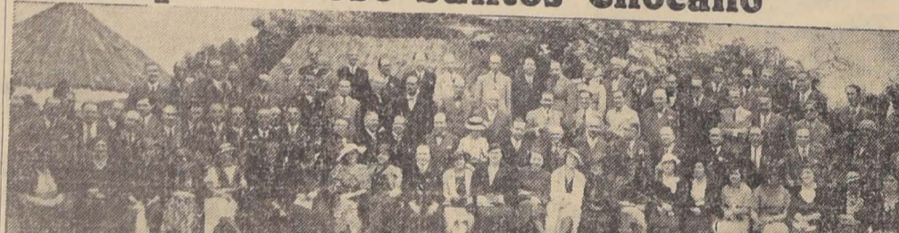
Asistentes al almuerzo que la Sociedad de Escritores ofreció ayer al poeta José Santos Chocano