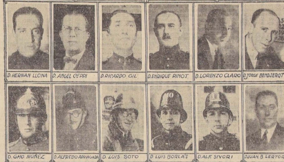
Las autoridades que forman el Cuerpo de Bomberos de Santiago

EN LA ELIPSE Una vez en la elipse, las Compañías formarán para efectuar el desfile de honor delante de las tribunas. Las 12 Compañías desfilarán con sus respectivos estandartes, para ceder luego el campo al material, formado en siete grupos, espaciados por una distancia de 40 metros. El 2.º Bombas 2.ª, 3.ª, 10.ª y 12.ª. — 3.º Bombas 5.ª y 9.ª. — 4.º Bombas 1.ª y 4.ª. — 5.º Bombas 6.ª, 7.ª, 8.ª y 12.ª. — 6.º Bombas 2.ª, 3.ª, 10.ª y 12.ª. — 7.º Bombas 5.ª y 9.ª. — 8.º Bombas 1.ª y 4.ª. — 9.º Bombas 6.ª, 7.ª, 8.ª y 12.ª. — 10.º Bombas 2.ª, 3.ª, 10.ª y 12.ª. — 11.º Bombas 5.ª y 9.ª. — 12.º Bombas 1.ª y 4.ª.