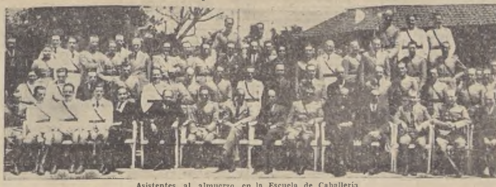
Asistentes al almuerzo en la Escuela de Caballería

Los actos de la mañana. — El almuerzo del mediodía. — Palabras del Coronel Vergara Lugo.