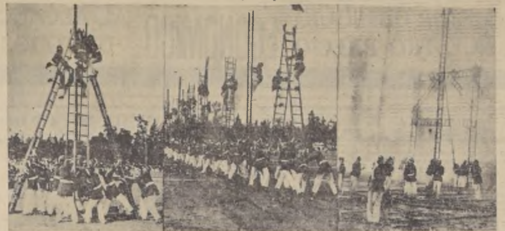
Diversos aspectos de las pruebas ejecutadas ayer por las Compañías de Bomberos

Las cortinas de agua de 48 pitones y las pruebas de salvamento fueron lucidas