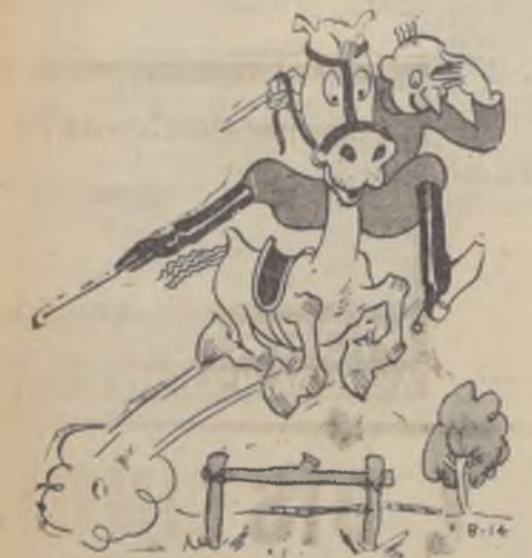
(Del "Romancero de Pipo")

El convenio también prevé la creación de una comisión de cooperación económica que se reunirá en París.