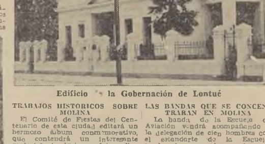
Edificio de la Gobernación de Lontué