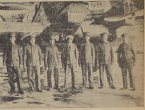
Personal de mecánicos