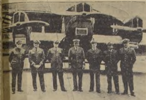
Pilotos de los Junkers