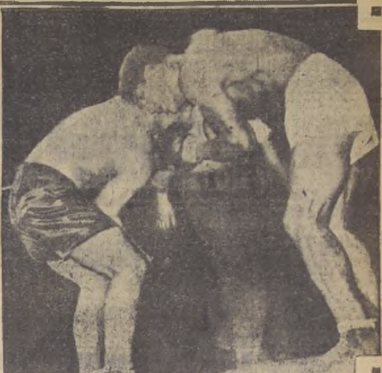
Un momento de in-fighting, en el que el gran Arturo Godoy sacó el partido necesario para derrotar en forma terminante al ídolo argentino. (Obsérvese el enorme blanco que dejaba Caratoli para recibir el formidable castigo del chileno).