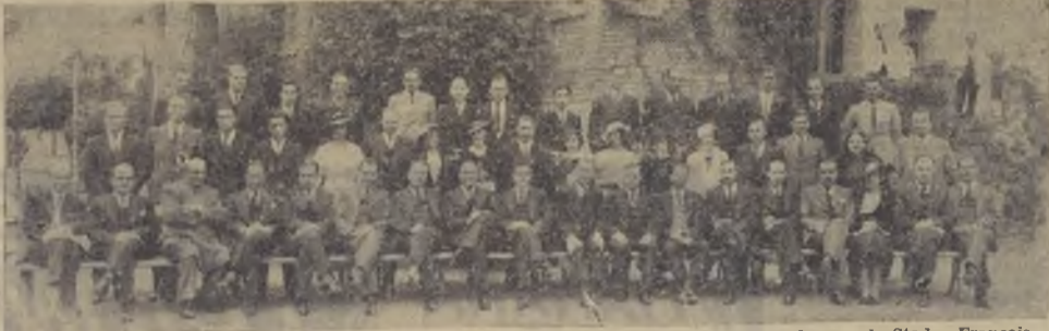
Asistentes al almuerzo que la Sección Accidentes del Trabajo ofreció a su personal en el Stade Francais