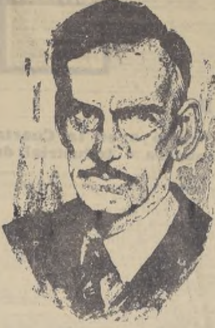
Eugenio O'Neil, la figura cumbre del teatro mundial contemporáneo...