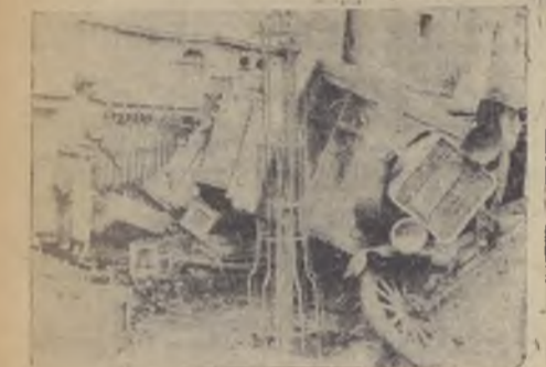
Estado en que quedó el camión volcado en la calle Santa Lucía