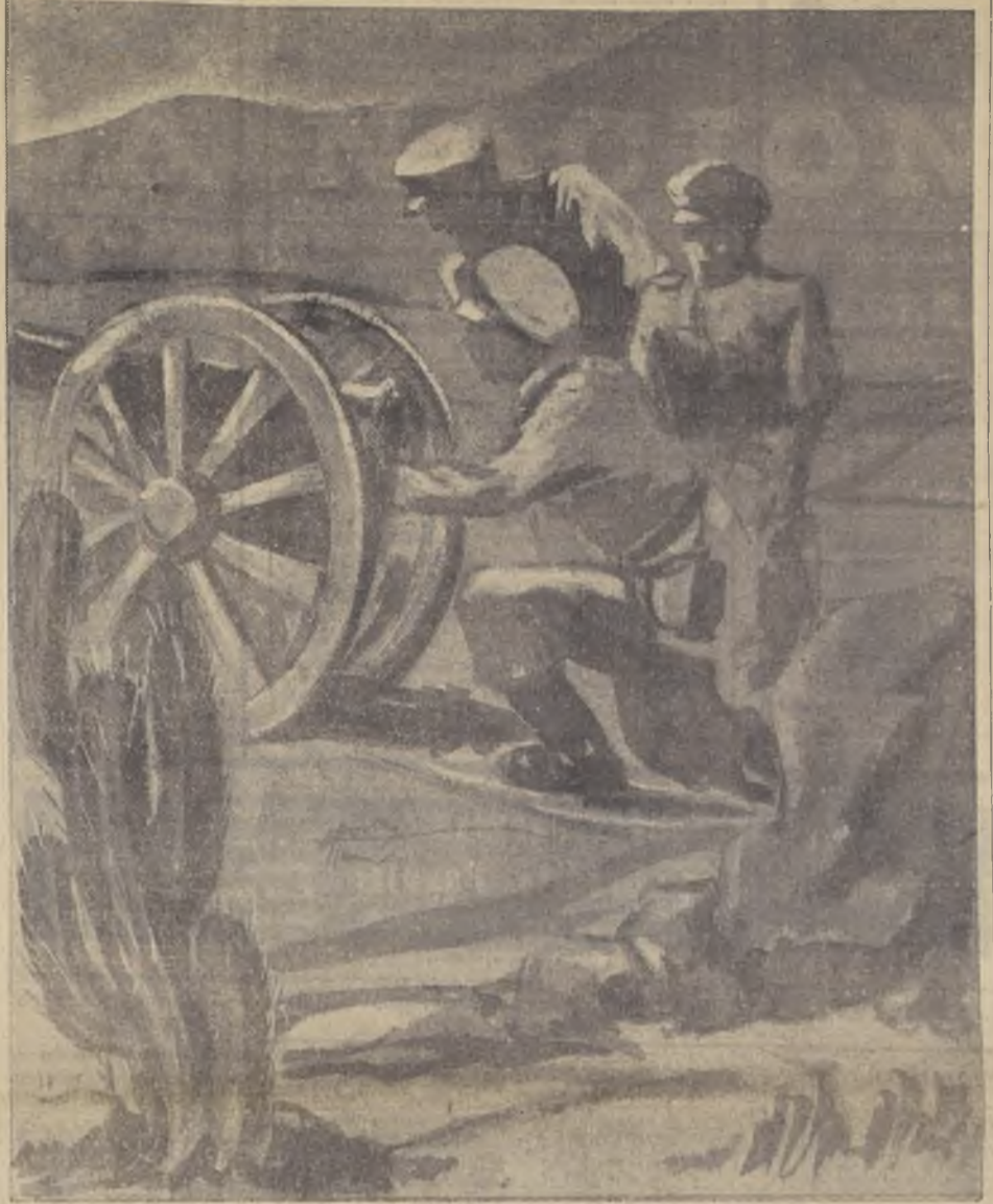
La oficialidad del arma de Artillería celebra hoy el día del arma, y con este motivo se ha confeccionado un programa de festejos, que se llevará a cabo en los Regimientos Tacna y Maturana.

Almuerzo en el Estadio Militar y programa deportivo en los Regimientos del arma de la capital