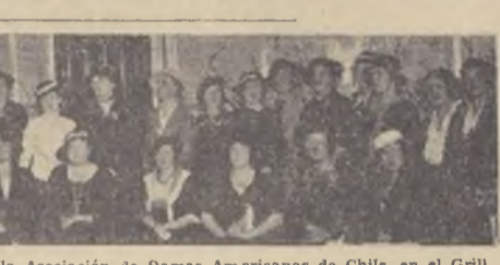
Asistentes al té celebrado por la Asociación de Damas Americanas de Chile...