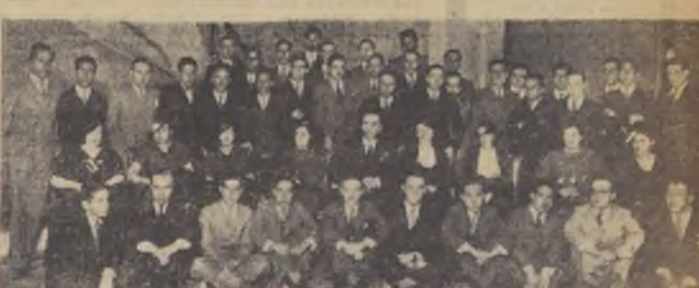
Asistentes a la manifestación que se efectuó en el Restaurant Da Osvaldo...