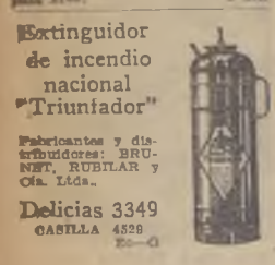
Extinguidor de incendio nacional "Triunfador"

CUIDADOR DE NOCHES para el Hotel de Turismo, 2300 Duro. 12 Dic.