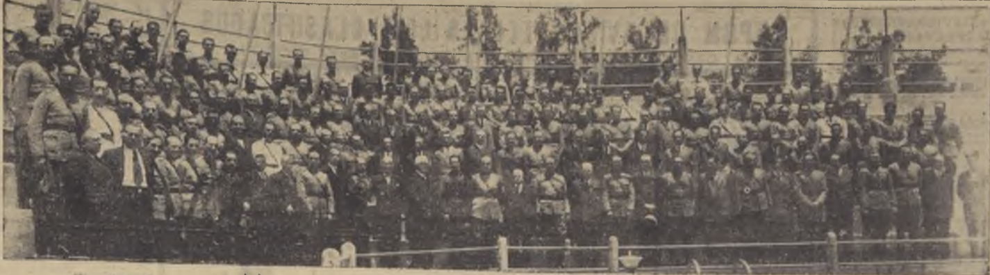
Asistentes a la celebración del Día de la Artillería, en el Estadio Militar