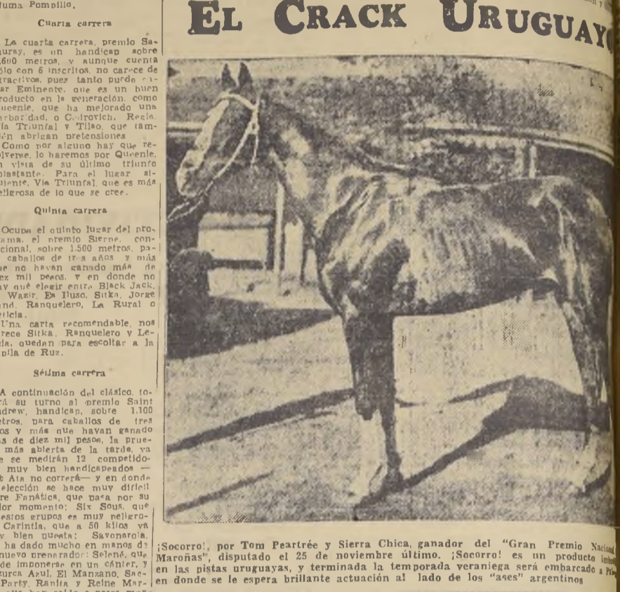
¡Socorro!, por Tom Peartree y Sierra Chica, ganador del "Gran Premio Nacional Maronás", disputado el 25 de noviembre último. ¡Socorro! es un producto latino en las pistas uruguayas, y terminada la temporada veraniega será embarcado a París donde se le espera brillante actuación al lado de los "ases" argentinos.

PRIMERA CARRERA La primera carrera, que se celebró a las dos y media, fue para caballos de tres años y más que ha reunido solamente 4 competidores: Quinchino, que era el favorito, con 56 kilos y Follore, Royal Master y Vindicta. El favorito del público, después de haber con toda seguridad Quinchino, ya que el Alim acaba de temer primer lugar, y Last Sandal, para el segundo. SEGUNDA CARRERA La segunda carrera es condicional, sobre 1.400 metros para caballos de tres años y más que se rematan en ocho mil pesos y entre los siete rivales que suarezcan inscritos, destacan la mejor opción Netter, que puede imponerse en un canter; Cascajo, que demostró cierta clase al batir a Sixte Alegre, no hace mucho; Dineis, cuya opción es imprecisa, ya que viene de escoltar a Savonera y Ruy Diaz, que al final puede aprovechar su airellado. Oplanto por Dineis, y Follore, por Ruy Diaz. No correrá Russell. TERCERA CARRERA La prueba destinada a tres años que no hayan ganado, debe resolverse entre Juan de Saura, que cuenta con algunas inscripciones; Huesca, que ha sido bastante placé a través de los