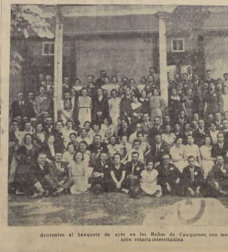
Asistentes al banquete de ayer en los Baños de Cauquenes, con motivo de la reunión rotaria intercitatina

RANCAGUA, 16.— Como informamos anteriormente, en las Termas de Cauquenes se verificó la reunión rotariana intercitatina organizada por los clubs de Rancagua y Rengo.