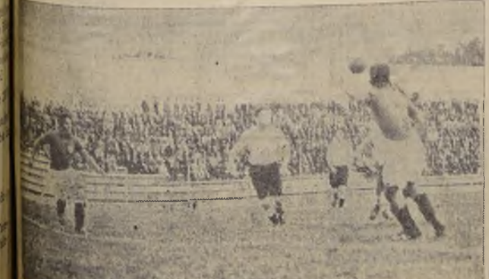
El jugador del equipo porteno en que se impuso el equipo porteno por cuatro tantos a uno