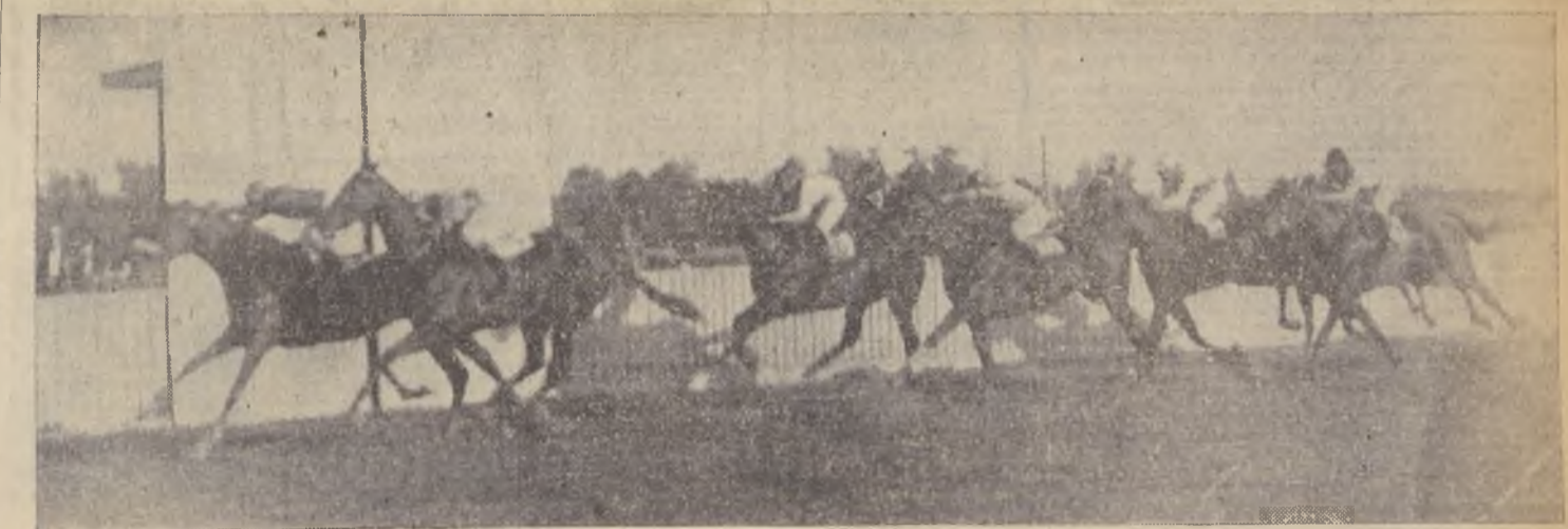
Chansonnier bató por 1 pescuezo a Collipulli. Terceros, en empate. El Sahib y Buen Gesto. 5.º Volga. 6.º Raudal

pletos de industrias regionales; lanas, tintas, frutas y plantas. La Sección Primaria presenta una colección completa de dibujos, especialmente con motivos indígenas; carpintería aplicada a la juguetería; cerámica, cestería cartonaje, etc. Llama la atención global el proceso de enseñanza global o centros de interés, vías de comunicación