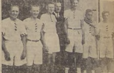
Equipo vencedor en la prueba para yolas