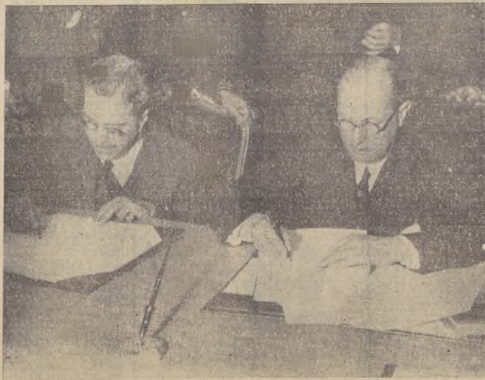
Durante la firma del tratado, anoche, en la Cancillería

A LAS 23 HORAS, EN PRESENCIA DE NUMEROSOS FUNCIONARIOS DE LA CANCELLERIA Y DEL MINISTERIO DE HACIENDA, EL MINISTRO DE RELACIONES EXTERIORES Y EL PRESIDENTE DE LA MISION COMERCIAL ALEMANA PUSIERON SUS FIRMAS EN LOS DOCUMENTOS RESPECTIVOS. — AMBAS NACIONES SE HAN CONCEDIDO MUTUAMENTE LAS CONDICIONES ABSOLUTAS DEL PAIS MAS FAVORECIDO PARA SUS RELACIONES DE COMERCIO Y FINANCIERAS. — EL TRATADO CONFIRMA LA IMPORTACION DE SALITRE CHILENO EN ALEMANIA Y LA COMPENSACION DE LOS CREDITOS ALEMANES CONGELADOS EN CHILE