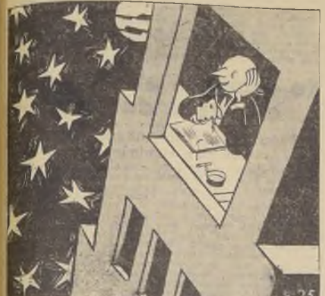
(De "El Romancero de Pipo")