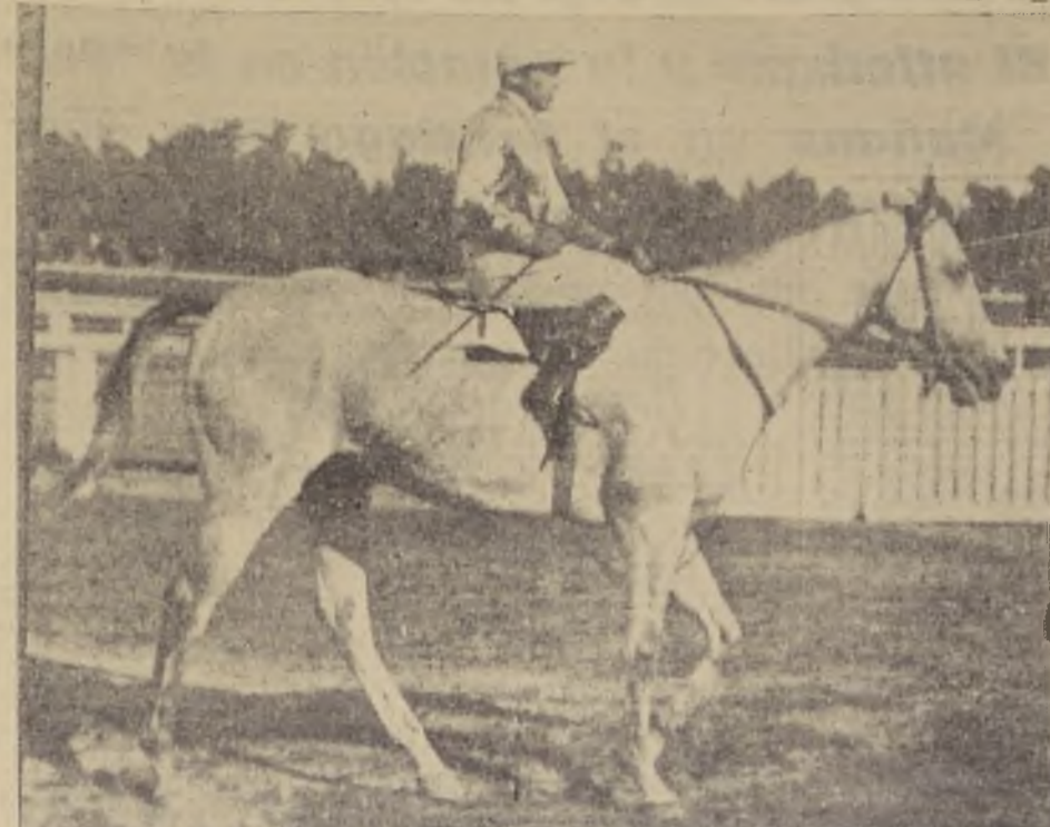
OAKLAND, el gran caballo del Kangaroo, que a pesar de sus seis años, fué el crack de las pistas chilenas en 1934