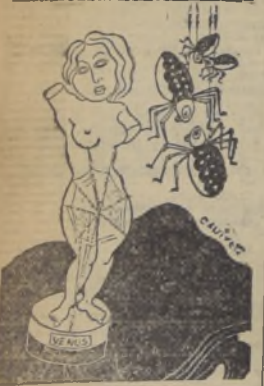
—Por haber niños en la casa, doctó me tejí un traje de telaraña... — (Le Rire, Paris)