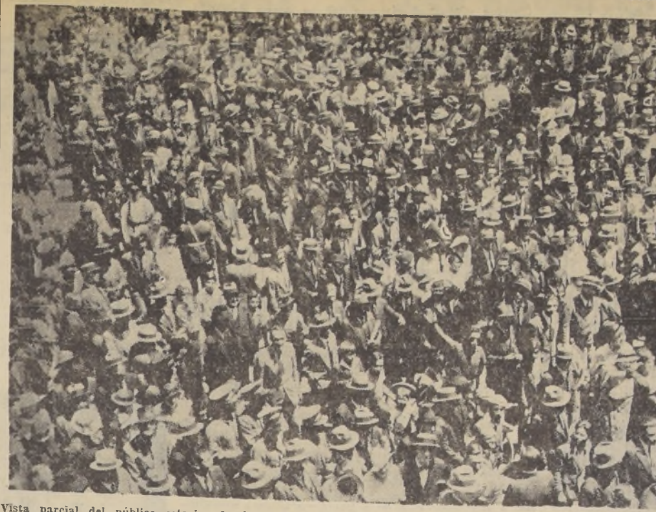
Vista parcial del público estacionado frente a la Moneda para presenciar el desfile de los marinos alemanes.