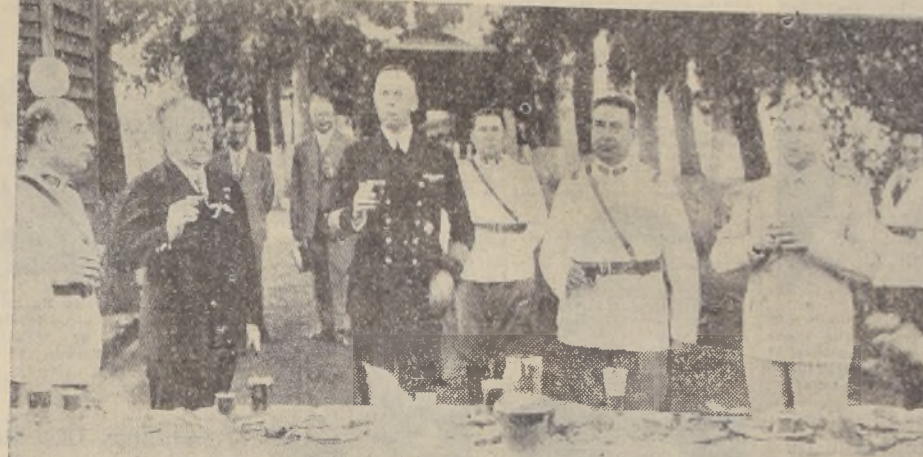
Durante la fiesta de ayer tarde en el Estadio Militar. El Comodoro Lütjens, el General Contreras, el Encargado de Negocios de Alemania y otras personalidades.