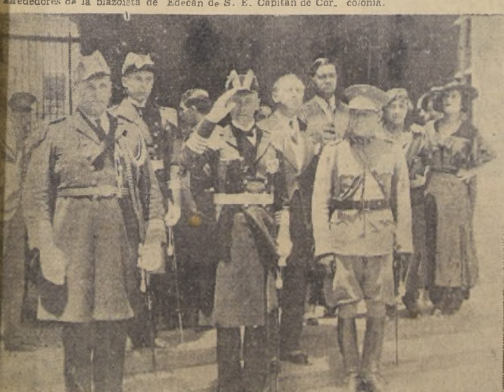
Comodoro Lütjens a la salida de la Presidencia de la República, saluda al público que lo aclama.