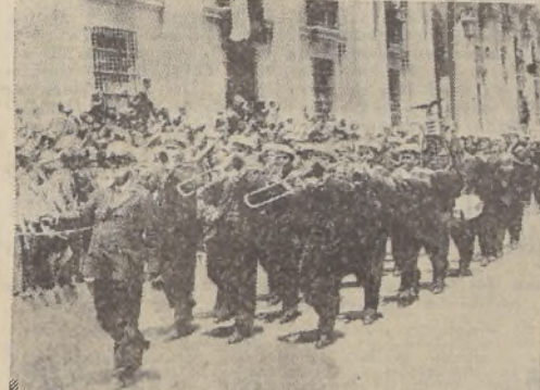
La banda del "Karlsruhe" defilando frente a la Moneda

pondió con un sonoro ¡Viva Chile! Después de pasar frente al Palacio, la columna siguió por la calle Moneda hasta Ahumada, donde dobló en dirección a la Plaza de Armas.